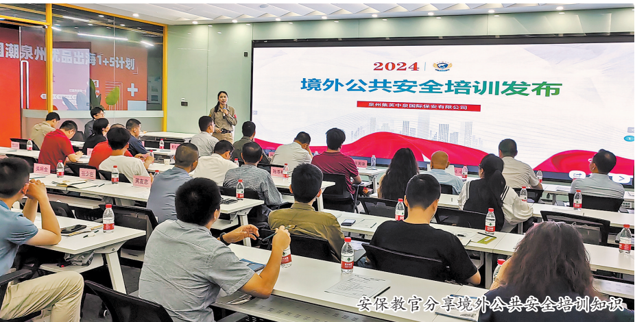
安保教官分享境外公共安全培训知识。