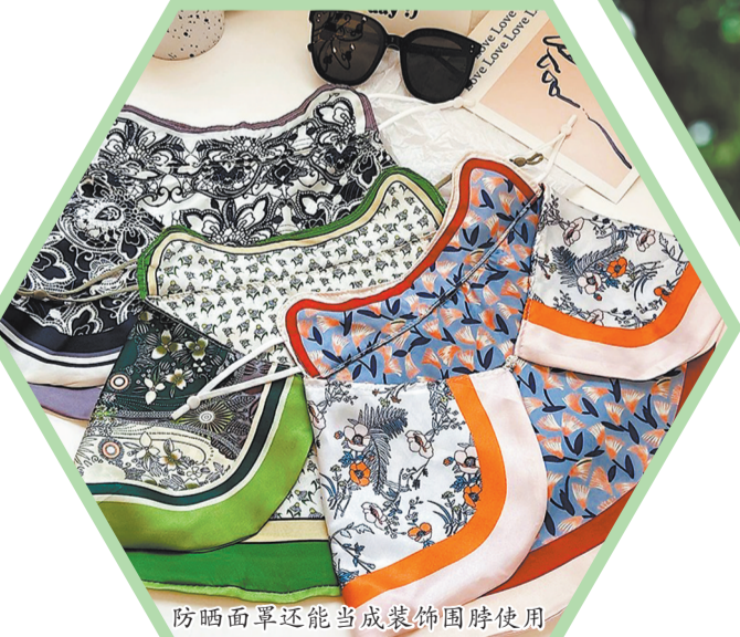
防晒面罩还能当成装饰围脖使用