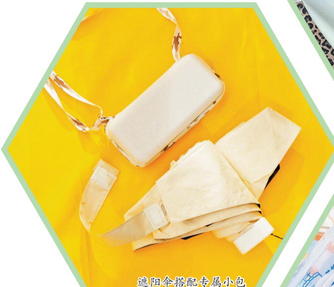
遮阳伞搭配专属小包