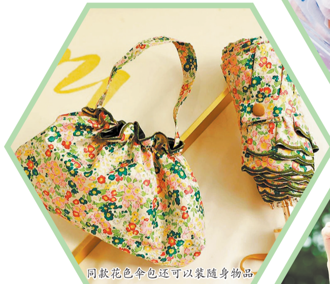
同款花色伞包还可以装随身物品