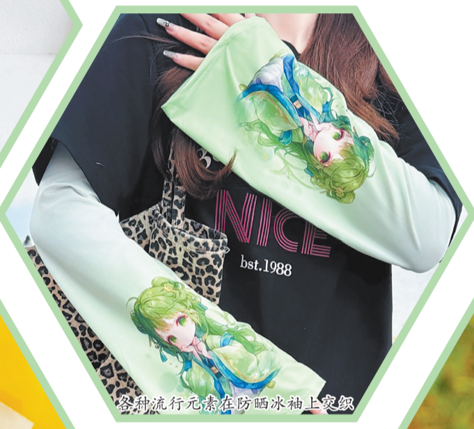
各种流行元素在防晒冰袖上交织