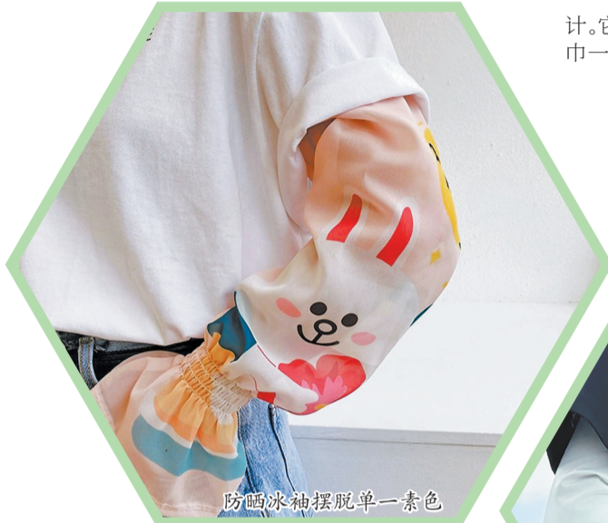
防晒冰袖摆脱单一素色

防晒衣也有了“小巧思”，花朵、卡通图案等元素“上身”，帽子上设计了动物耳朵等，让防晒衣看起来不再单调。不少市民熟知的运动品牌和服装品牌进入防晒衣市场，带来更时尚的剪裁，防晒衣不再只有上衣，时尚美观的防晒套装受到追捧，成为夏日出行的“潮人”新装备。