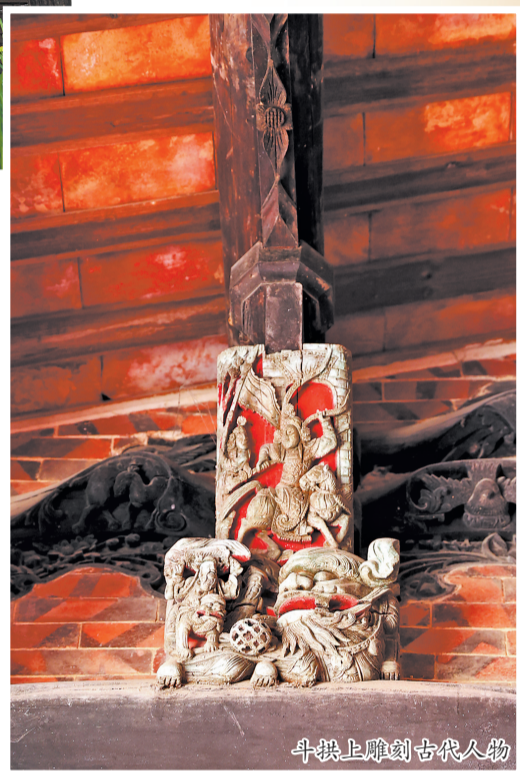
斗拱上雕刻古代人物