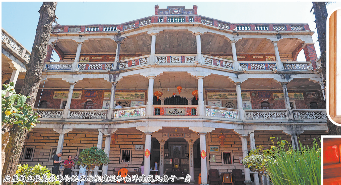
后座的主楼集传统石结构建筑和南洋建筑风格于一身