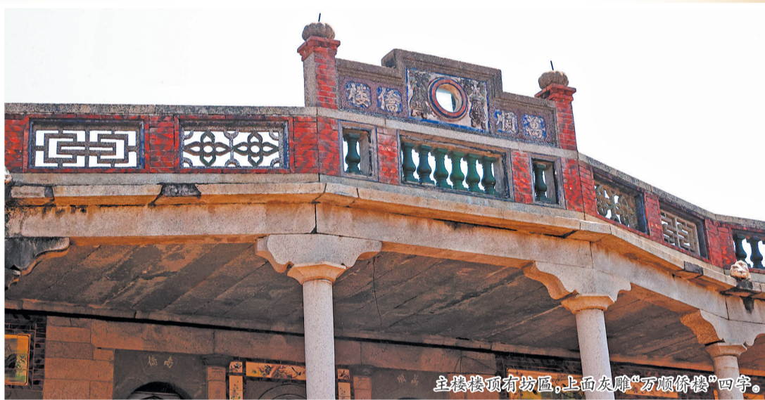
主楼楼顶有坊匾,上面灰雕“万顺侨楼”四字。