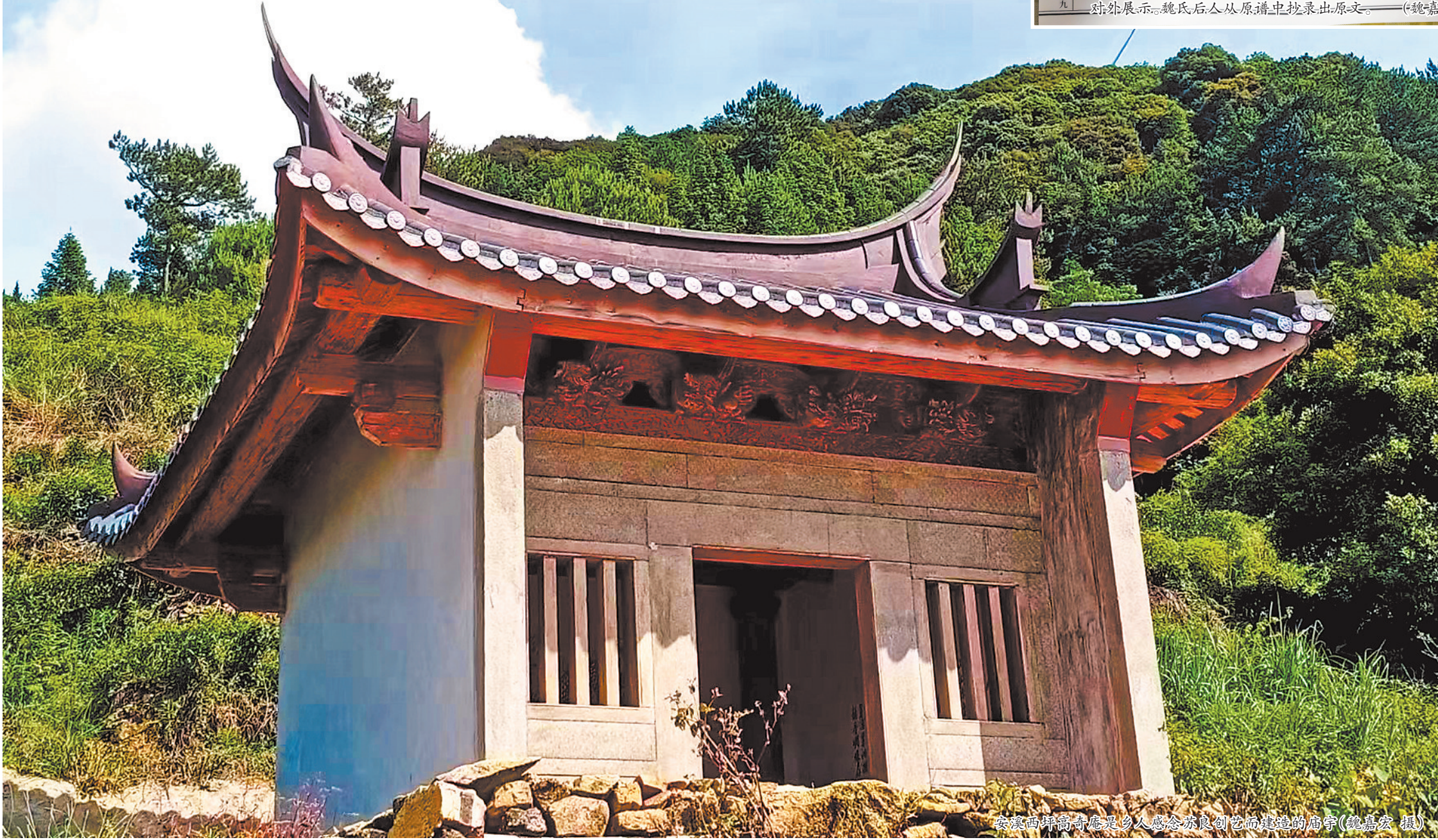
安溪西坪高奇庵是乡人感念苏良创艺而建造的庙宇（魏嘉安一摄）

始修于明朝的《肱传魏氏通谱》因年代久远，无法轻易对外展示。魏氏后人从原谱中抄录出原文。（魏嘉安一摄）