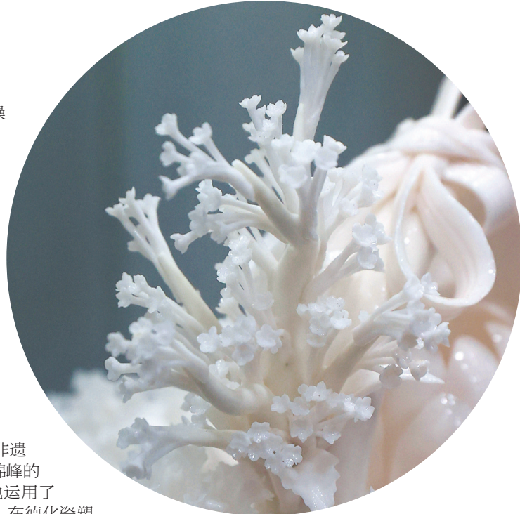
德化瓷花薄如蝉翼形象逼真

通过分段煅烧很自然地融合在一起,这是这件作品的难点也是作品的看点。此外,薄如蝉翼的纸张、根根分明的发丝、细节逼真的褶皱、温润如玉的质感……各类题材精品不胜枚举。