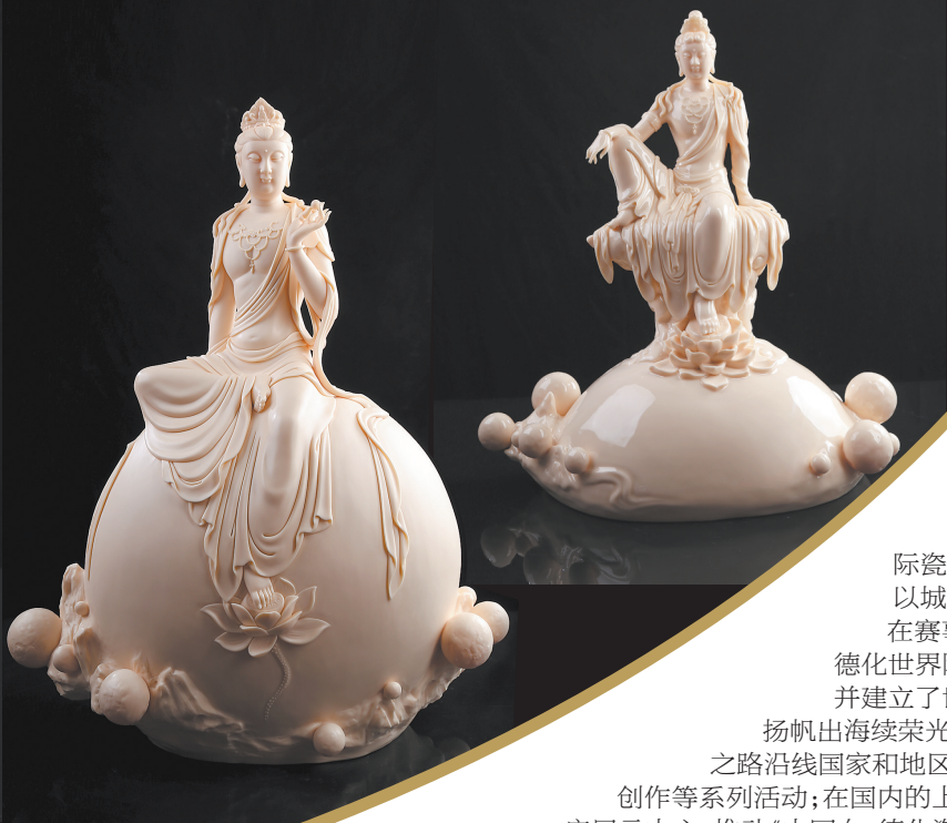
李锦峰作品《三千大千世界》