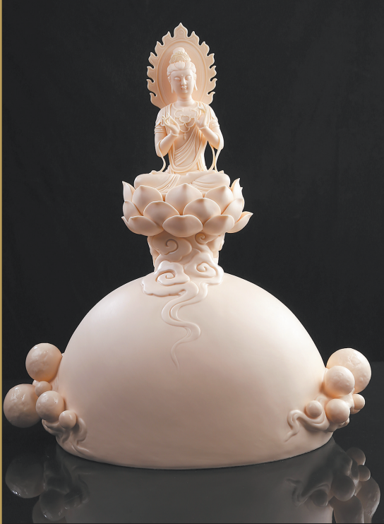
李锦峰作品《三千大千世界》