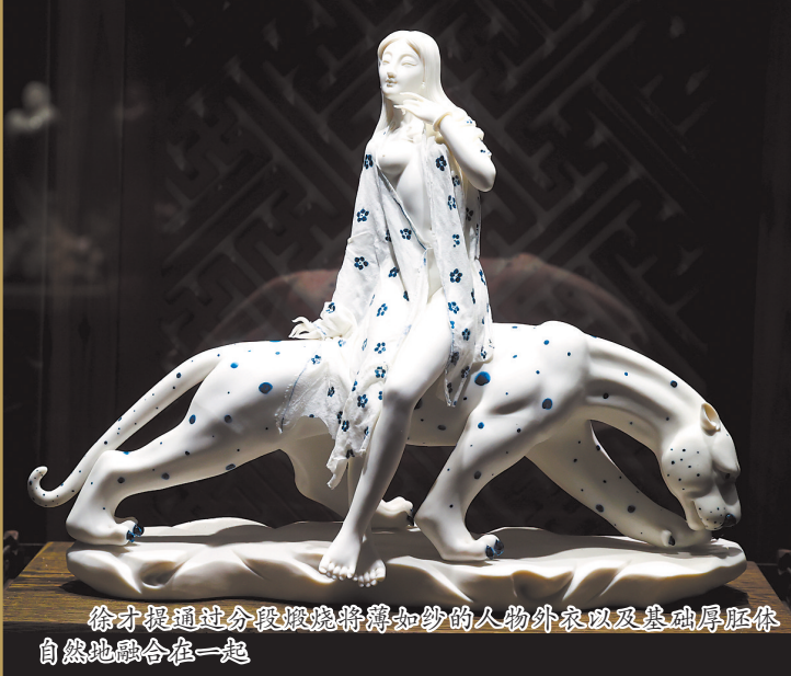
徐才提通过分段煅烧将薄如纱的人物外衣以及基础厚胚体自然地融合在一起