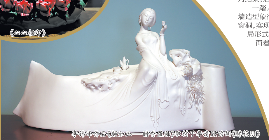
李锦峰作品《颜如玉——暗香盈袖》取材于李清照的词《醉花阴》