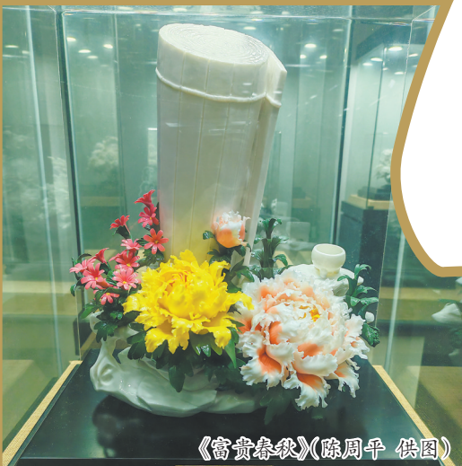
《富贵春秋》