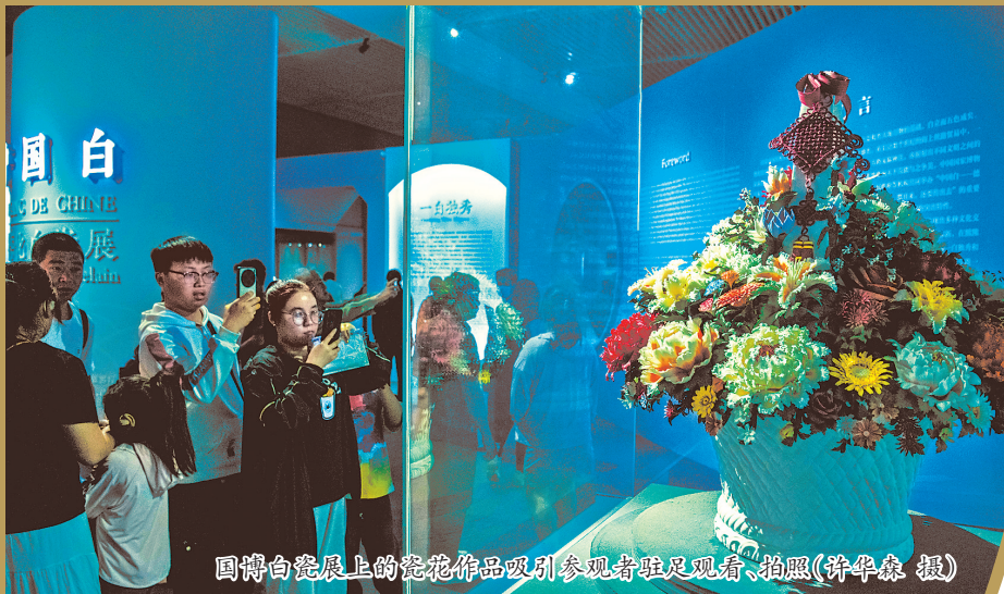
国博白瓷展上的瓷花作品吸引参观者驻足观看、拍照