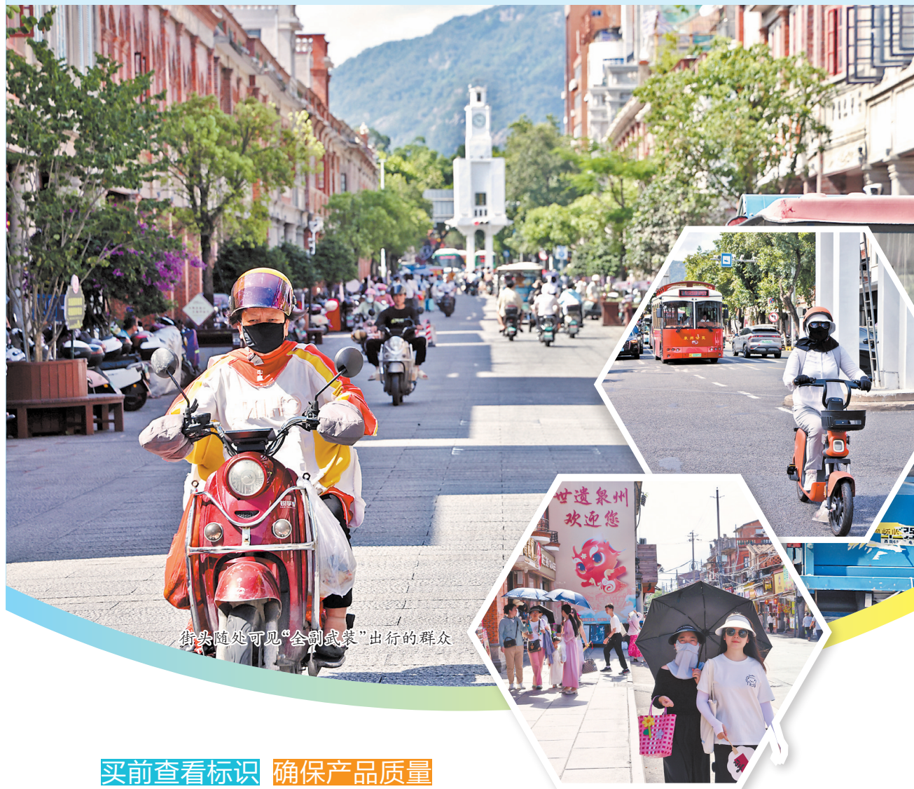
街头随处可见“全副武装”出行的群众