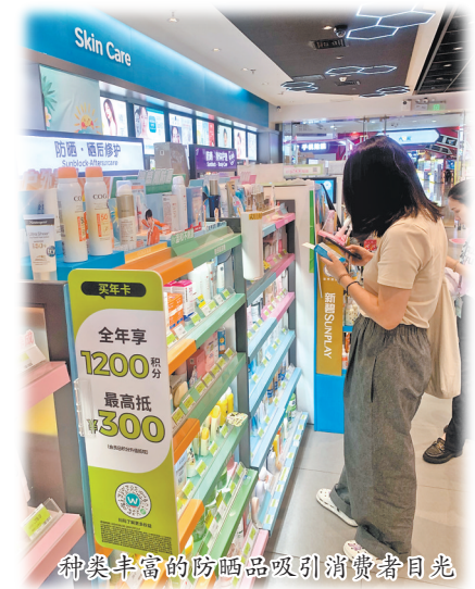
种类丰富的防晒品吸引消费者目光

据了解,一些人将使用防晒霜、防晒喷雾叫做“软防晒”,而直接阻隔皮肤和紫外线的防晒方式则称为“硬防晒”,也叫“物理防晒”,比如戴防晒帽、穿防晒衣、打伞等。记者走访了解到,“硬防晒”的方式由于更加简单直接更受市民青睐,使用群体更为广泛。