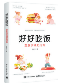
段俊杰 著 电子工业出版社

该书分享的方法聚焦心理学领域,引导人们从内心深处改变对胖瘦、食物和运动等的焦虑,科学地调整饮食结构,培养新的饮食习惯,从“我不能吃多”转变为“我不想吃多”,真正将内心的阻力转化为减肥的动力,最终蜕变为轻盈崭新的自己。