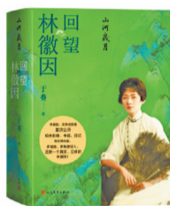
《山河岁月:回望林徽因》 于葵著 人民文学出版社

这些难得的日常片段场景,逐渐组合成了一个栩栩如生的林徽因,书中还有很多诗文选段,可以直观感受林徽因的风采。这也是我极力推荐大家读这部传记的原因。