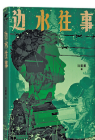
沈星星 著 天津人民出版社

书中内容来自作者的亲身经历。2009年,沈星星机缘巧合踏上金边坡的土地,成了一名给毒贩送假货的卡车司机。整整397天,他跟毒贩、赌徒、黑社会生活在一起。在这之前,他从没想过现实世界这么糟糕。一系列恍如隔世的离奇事件发生后,沈星星决定连夜逃回国内自首,并协助警方打击掉了长年盘踞深山的贩毒链条。他把在金边坡的人和事,记录在了书中的故事里。