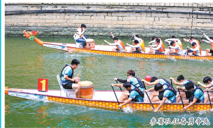
参赛队伍奋勇争先