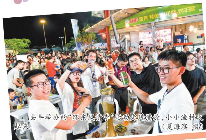
去年举办的“环东风情季”活动走进潘涂,小小渔村嗨起来。

同时,根据蒲头、后田、潘涂、丙洲四村“一村一品”,打造手持海鲜卷、和潘涂“蚝大王”勾肩搭背戴土龙围脖、螃蟹头套等延伸造型,充分发挥文旅IP的强大辐射带动作用 and 引流效应,助力乡村文旅发展,共同打造同安文旅新名片。