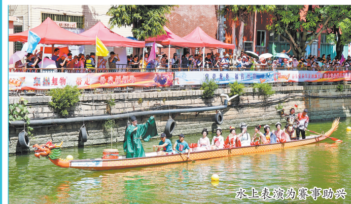
水上表演为赛事助兴