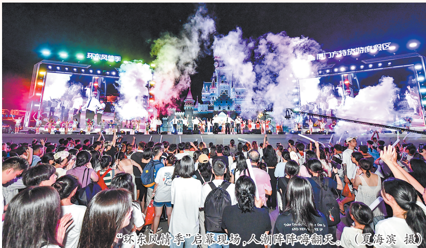
“环东风情季”启幕现场,人潮阵阵嗨翻天。

当然,到渔村不仅仅是享受舌尖上美食,“接地气”的渔村风情,也吸引越来越多的游客。你还可以到吕厝华藏庵近距离探访体验王船文化、浦头十八王公庙、丙洲民族英雄陈化成、南音、原生态闽南古厝、渔乡风情等,这些都值得游玩打卡。