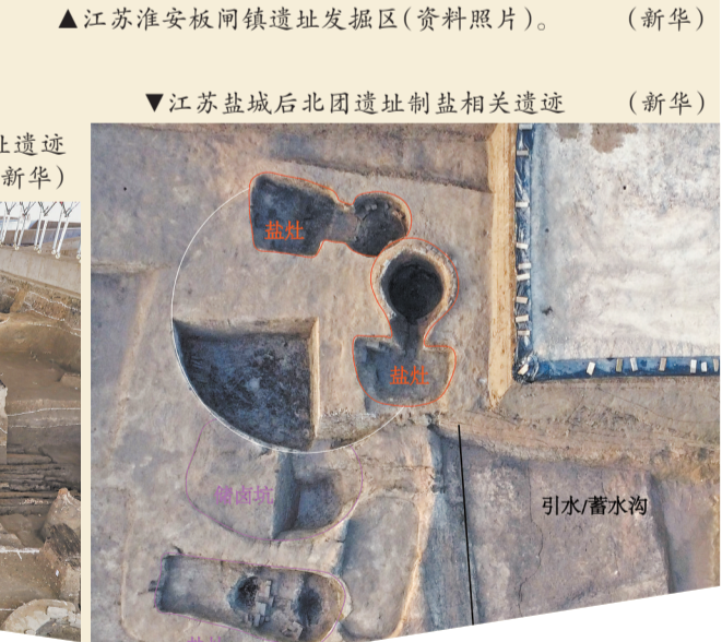
▼江苏盐城后北团遗址制盐相关遗迹