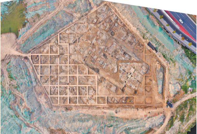
▲江苏淮安板闸镇遗址发掘区(资料照片)。(新华)