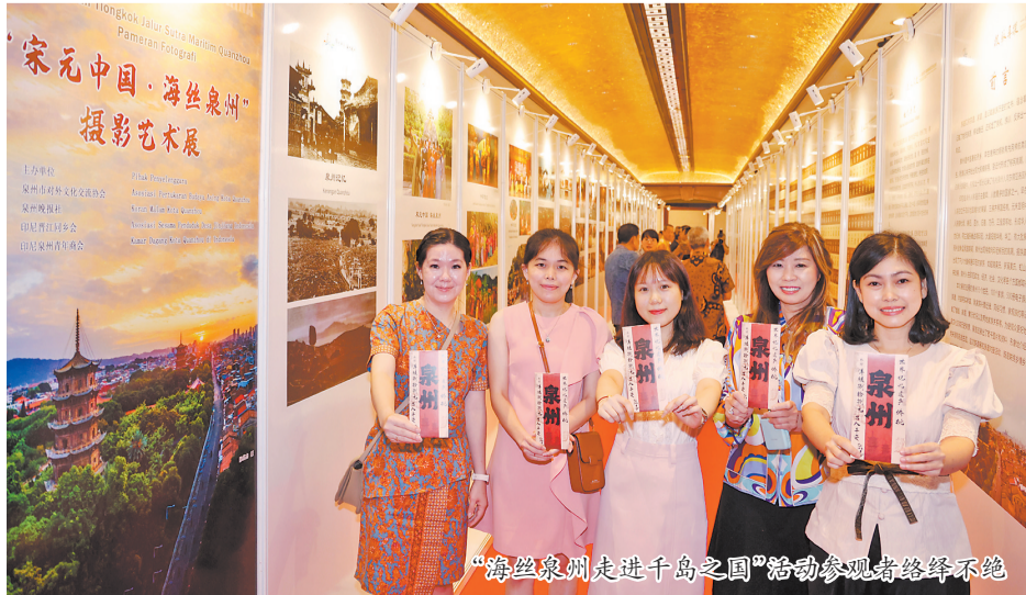
“海丝泉州走进千岛之国”活动参观者络绎不绝

泉州是印尼华侨华人的主要祖籍地之一。“海丝泉州走进千岛之国”活动是展示“世遗泉州”文化、华侨文化,促进中国和印尼两国文化交流,增进两国民间友好往来的重要活动。