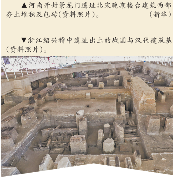
▼浙江绍兴稽中遗址出土的战国与汉代建筑基址遗迹(资料照片)。