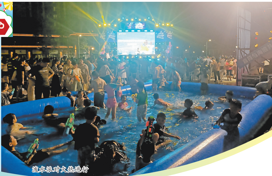
泼水派对火热进行