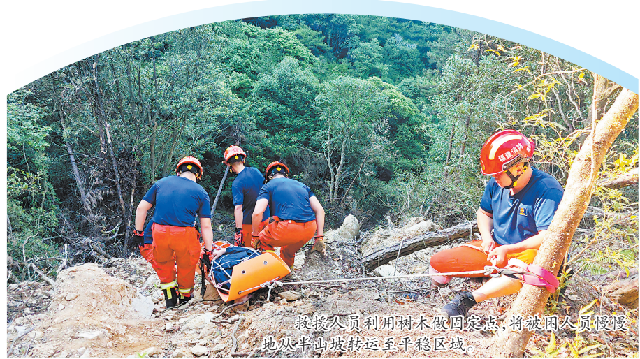
救援人员利用树木做固定点,将被困人员慢慢拖下山坡转运至平稳区域

本报讯(融媒体记者陈明华 通讯员许振塔 罗元煌 张徐洋 文/图)21日5时30分许,三名驴友在德化县赤水镇戴云山七里洋山场附近,途经一处路段时,其中一人脚没踩稳,不慎滑倒导致小腿骨折。事发后,德化消防、德化县公安局赤水派出所民警、120急救中心医护人员等救援人员立即赶往现场展开营救。