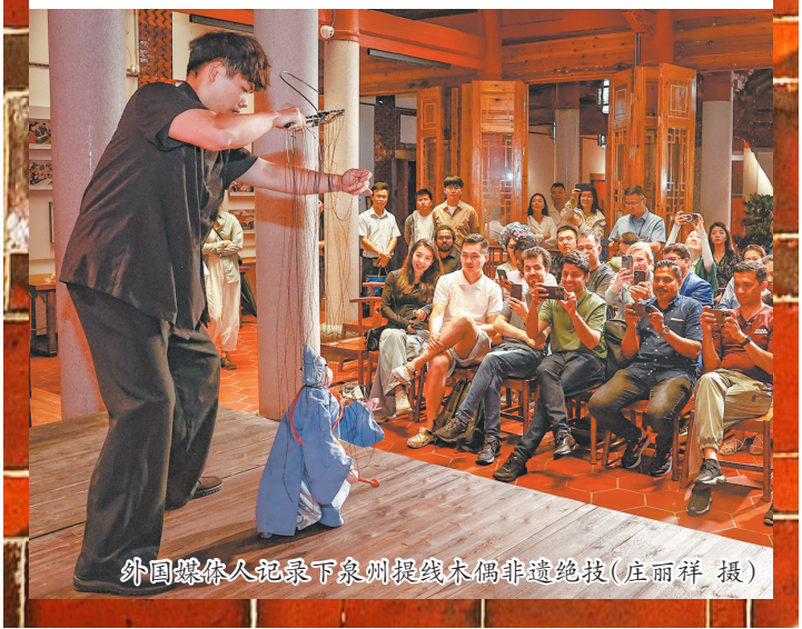
外国媒体人记录下泉州提线木偶非遗绝技(庄丽祥 摄)