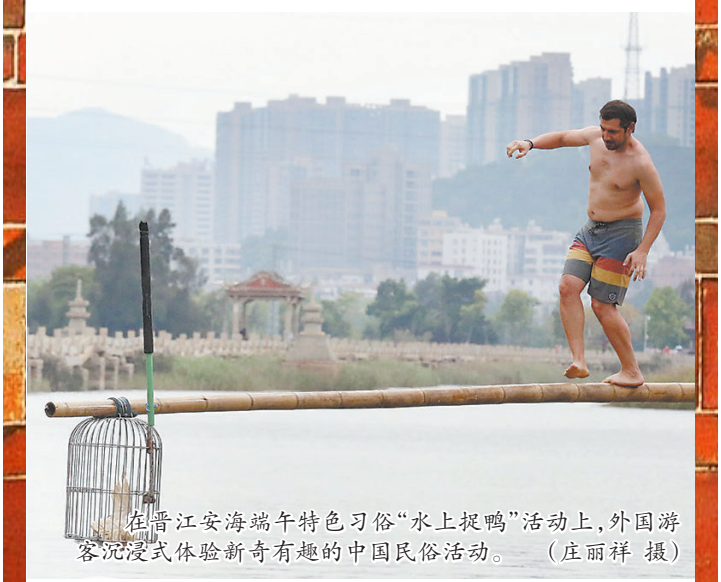
在晋江安海端午特色习俗“水上捉鸭”活动上,外国游客沉浸式体验新奇有趣的中国民俗活动。