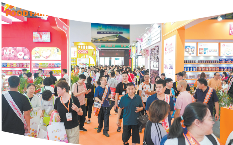
食交会现场吸引众多国内外客商前来寻觅商机

本届食交会共设置6万平方米展览面积、2700个标准展位，划分六大主题馆及中国食品科技创新成果展示区、抖音官方选品区、军创企业产品(食品)区、进口馆、网红新品馆、名优食品馆、区域品牌馆等特色展区，吸引超过1200家企业携带“名优特”产品参展。连日