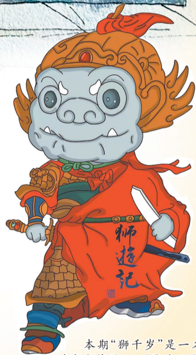
本期“狮千岁”是一名南朝大将军