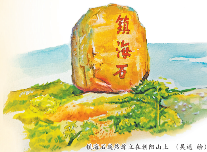
镇海石巍然耸立在朝阳山上 (吴逸 绘)

各位看官，今天你们可要稳稳喽，紧跟我“狮千岁”的脚步，去逛一逛位于石狮市永宁镇的永宁古卫城。这里古时曾经历过刀光剑影的洗礼，巡视这座古城，或许你能触碰到它风雨沧桑的时光印迹，体验那种浴火重生的勇气和希望。