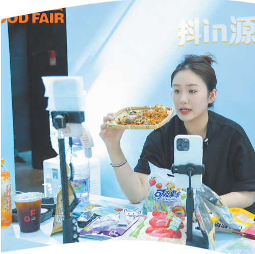
展会现场进行带货直播