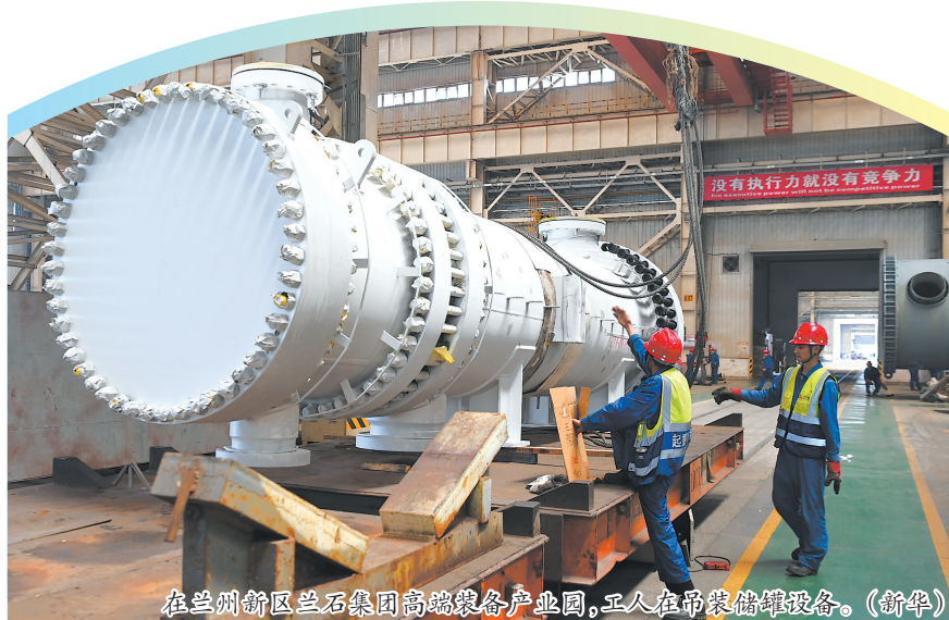
在兰州新区兰石集团高端装备制造产业园,工人在吊装储罐设备。

企业预期保持乐观。生产经营活动预期指数为53.1%,比上月下降1.3个百分点,仍位于扩张区间。从行业看,医药、铁路船舶航空航天设备、电气机械器材等行业生产经营活动预期指数均位于57%以上较高景气区间,企业对相关行业发展信心较强。