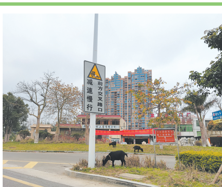
左图:国道324线洛阳桥头段,山羊正在啃食绿化带。