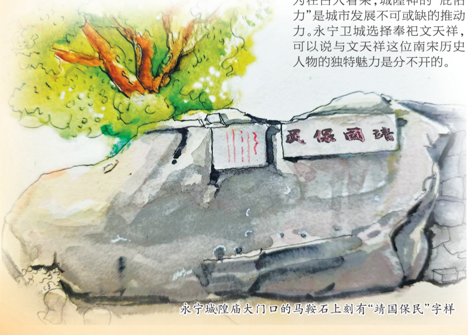
永宁城隍庙大门口的马鞍石上刻有“靖国保民”字样