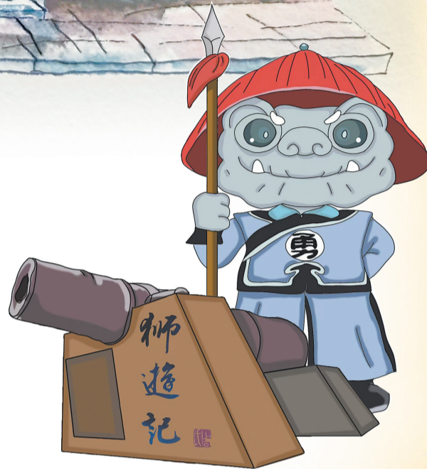
永宁城隍庙前陈列着一门损毁的明代嘉靖年间铸造的古炮，是明清时期永宁百姓保境安民的历史见证。

永宁城隍庙由门楼、前殿、戏台、拜亭、后殿和左右厢房组成。庙的规制完备，除主祀城隍神外，还模仿封建仪制，设置二十四司、四大将、三夫人、役吏差官等近百尊神像，是闽南地区少有的规模较大、保存较完整的一座城隍庙。其建筑结构严谨、精美，书法、联文、木雕、石雕、砖刻均出自明、清高手。门楼两侧“雷厉”“风行”四个石刻大字，书法遒劲、端庄大气。拜亭两侧的清代石雕狮子栩栩如生，雕工精湛。该庙于1996年2月被列为第四批省级文物保护单位。