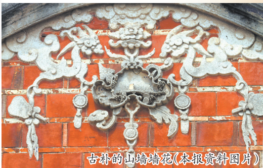
古厝的山墙墙花

穿行在泉州古城,不经意间,你就能看到闽南红砖古厝、异域风情的建筑。这既是建筑美学的盛宴,也是开放、包容的闽南精神的体现。