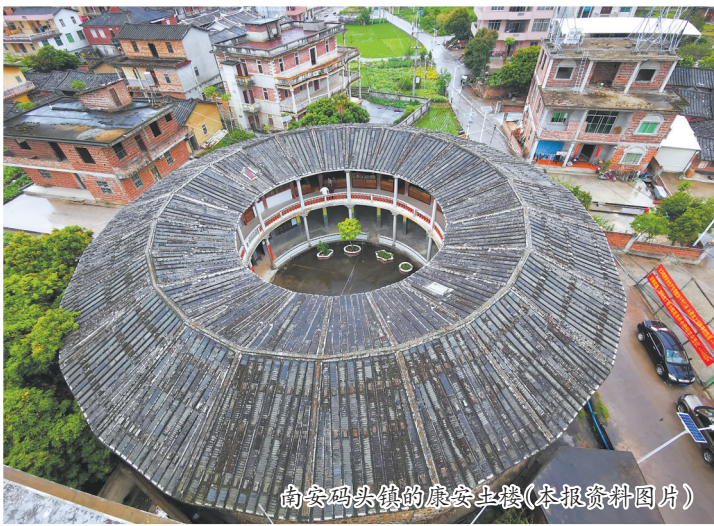
南安码头镇的康安土楼