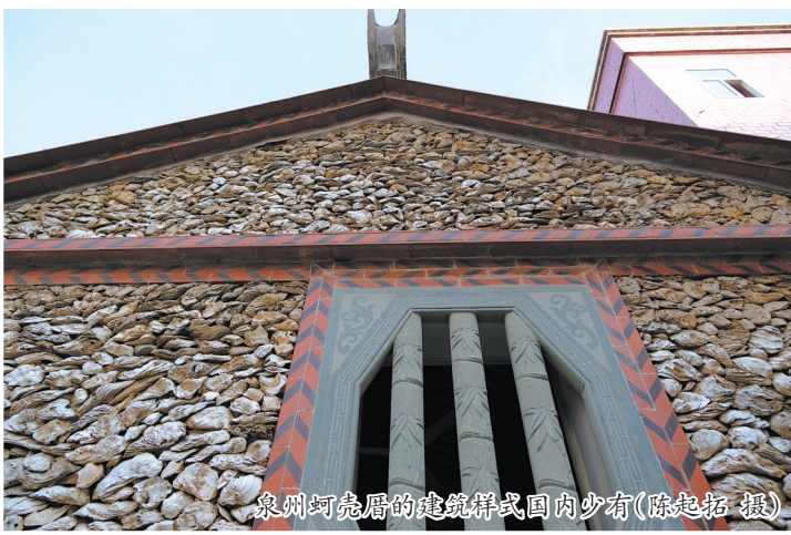
泉州蚵壳厝的建筑样式国内少有