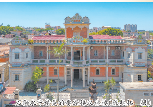
石狮永宁精美的番客楼汉林楼