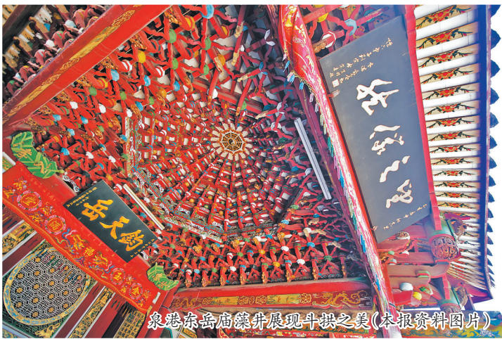
泉州东岳庙梁架展现斗拱之美