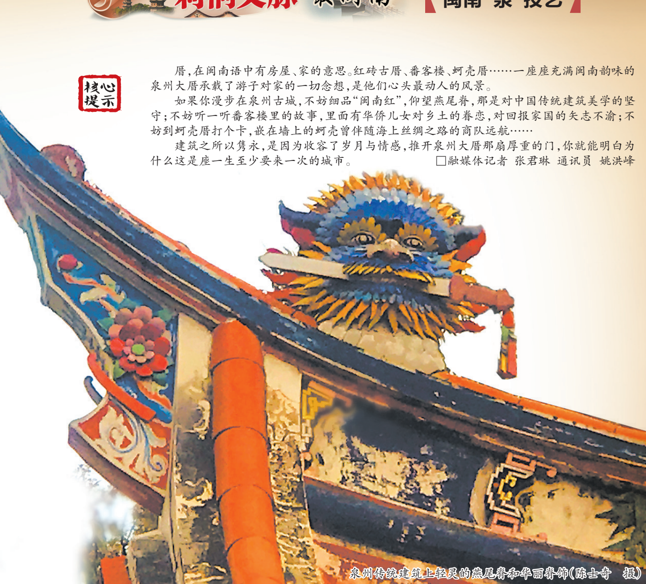
泉州传统建筑上轻灵的燕尾脊和华丽装饰