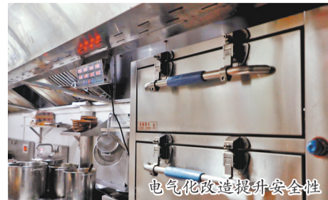
电气化改造提升安全性

本报讯(融媒体记者王金植 通讯员李淑媚 林志福 文/图)近日,鲤城区旧馆驿24号民居完成“气改电”改造,这是鲤城区首个完成电气化改造的文物建筑。