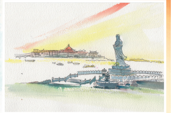
高大的踏浪观音石像矗立在海岸边(吴嵘彦 绘)

波荡漾的海水环绕。一旦涨潮,寺庙便似在海面上漂浮、悬空,有种海上仙阁的即视感;等到退潮时,它又与陆地相连,仿佛看破世俗的老僧在岛岩上入定。洛伽寺的建筑风格独特且富有韵味,巧妙地在古朴庄重的庙宇建筑中糅入巧夺天工的雕刻艺术。寺庙内的大雄宝殿、藏经楼等建筑各具特色,雕梁画栋、金碧辉煌。