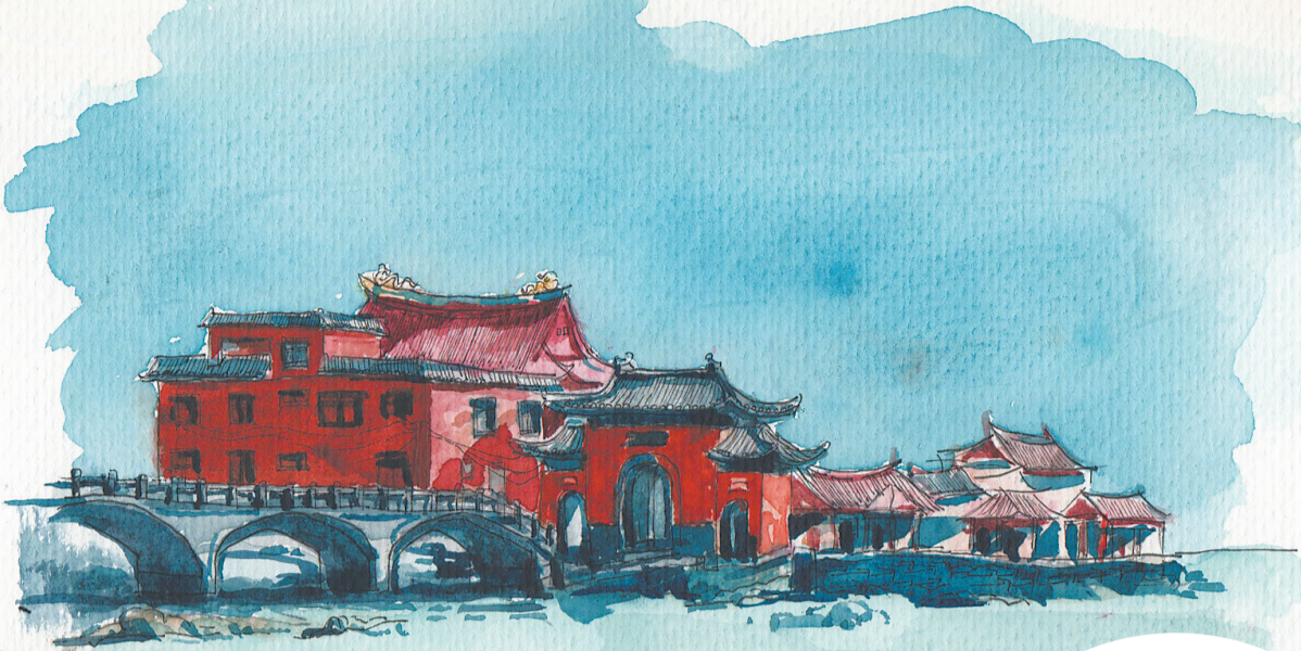
洛伽寺的建筑风格独特(吴嵘彦 绘)

线呈月牙形,绵延十几公里,拥有出色的亚热带自然风光,是一处集“行、游、吃、住、购、娱”于一体的滨海旅游度假区,也是福建省十大重点旅游景区之一。其历