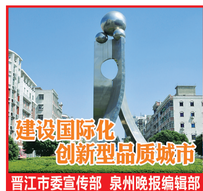
建设国际化创新型品质城市 晋江市委宣传部 泉州晚报编辑部