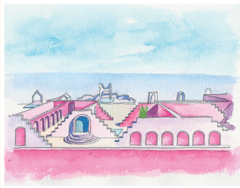
橘若如一座“粉色城堡”(吴嵘彦 绘)

生活是否已经让你有了些许疲惫?不要紧,亲爱的朋友,感到疲惫的时候不妨停下来看海吧!看海天一色的美景,看白色浪花拥簇成花,你的心情一定会变得轻松愉悦起来。