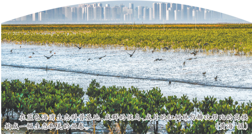
在蓝色海湾生态科普基地,成群的候鸟、成片的红树林与嬉戏嬉戏的岸鸥构成一幅生态和美的画卷。(黄海根)

江滩涂是“陈埭蛭”的传统养殖基地,互花米草入侵后,生长迅速,蔓延面积达5000多亩,侵占大部分滩涂,导致鸟类失去栖息和觅食空间,严重威胁区域生物多样性的多样性。