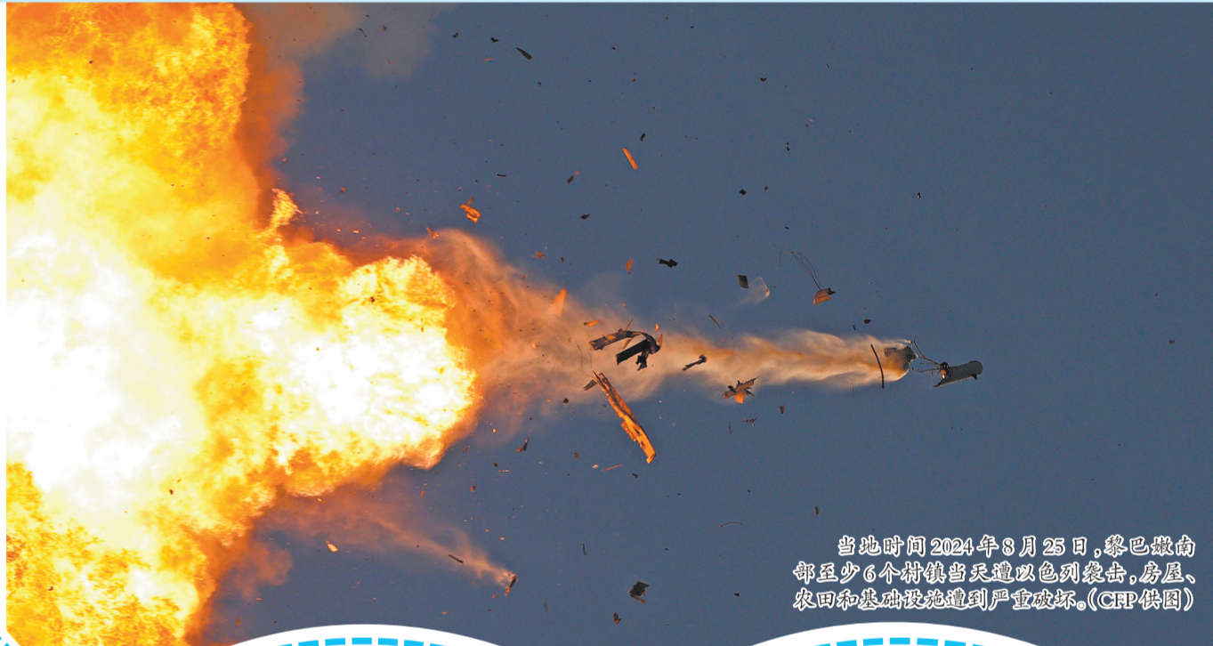
当地时间2024年8月25日,黎巴嫩南部至少6个村镇当天遭以色列袭击。房屋、农田和基础设施遭到严重破坏。

7月30日,以空军战机在黎首都贝鲁特地区展开“定点清除”行动,真主党高级军事指挥官阿德·舒库尔在空袭中被炸死。黎巴嫩真主党领导人纳斯鲁拉多次表示将就此对以色列进行报复。