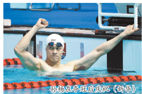
孙杨在夺冠后庆祝。

新华社合肥8月25日电 25日,2024年全国夏季游泳锦标赛在安徽合肥开赛。在备受关注的男子400米自由泳决赛中,代表浙江队出战的孙杨以3分49秒58的成绩夺冠,他在赛后说“这是一个好的开端”。