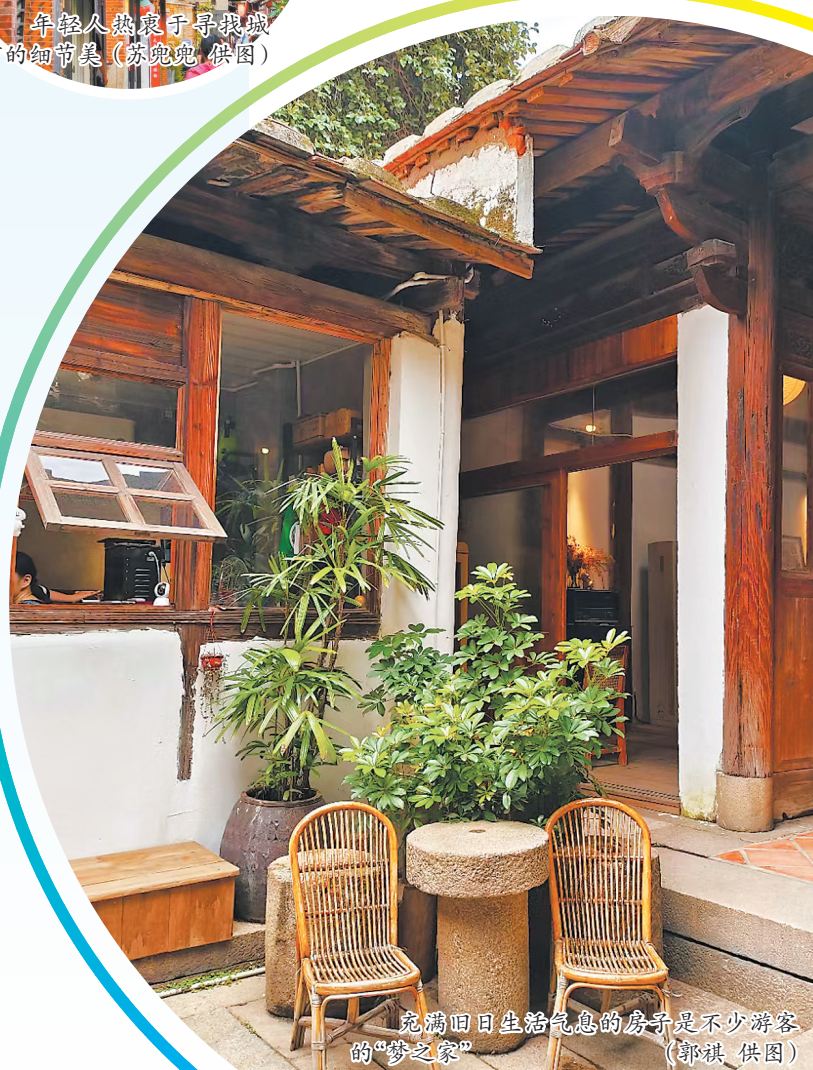
充满旧日生活气息的房子是不少游客的“家”