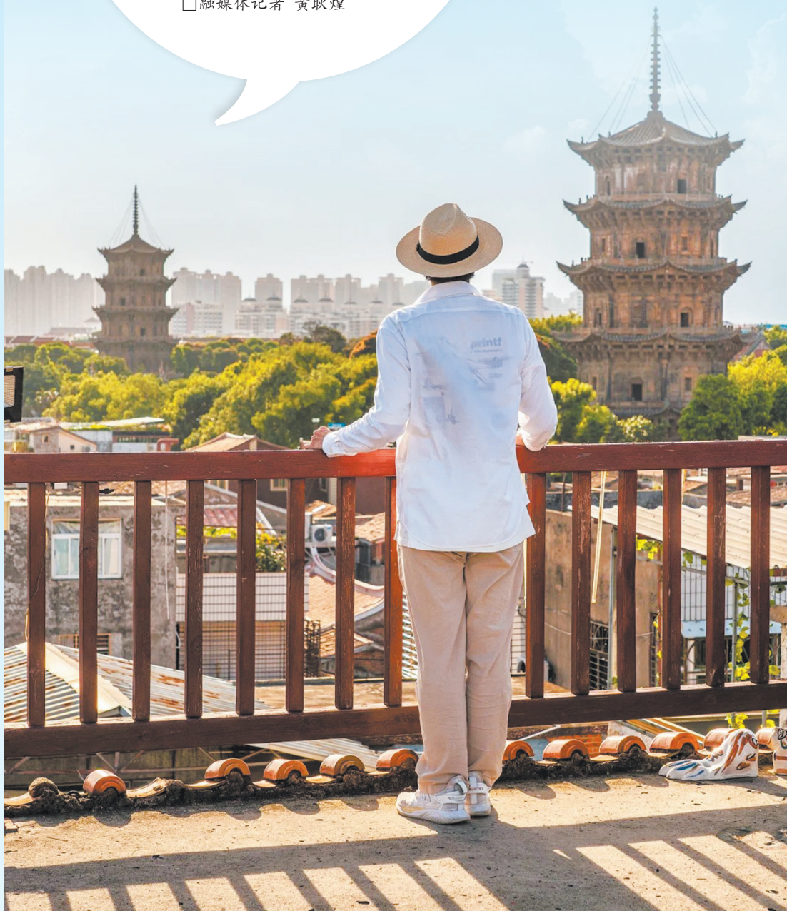
▲年轻游客用镜头展示泉州的生活和美