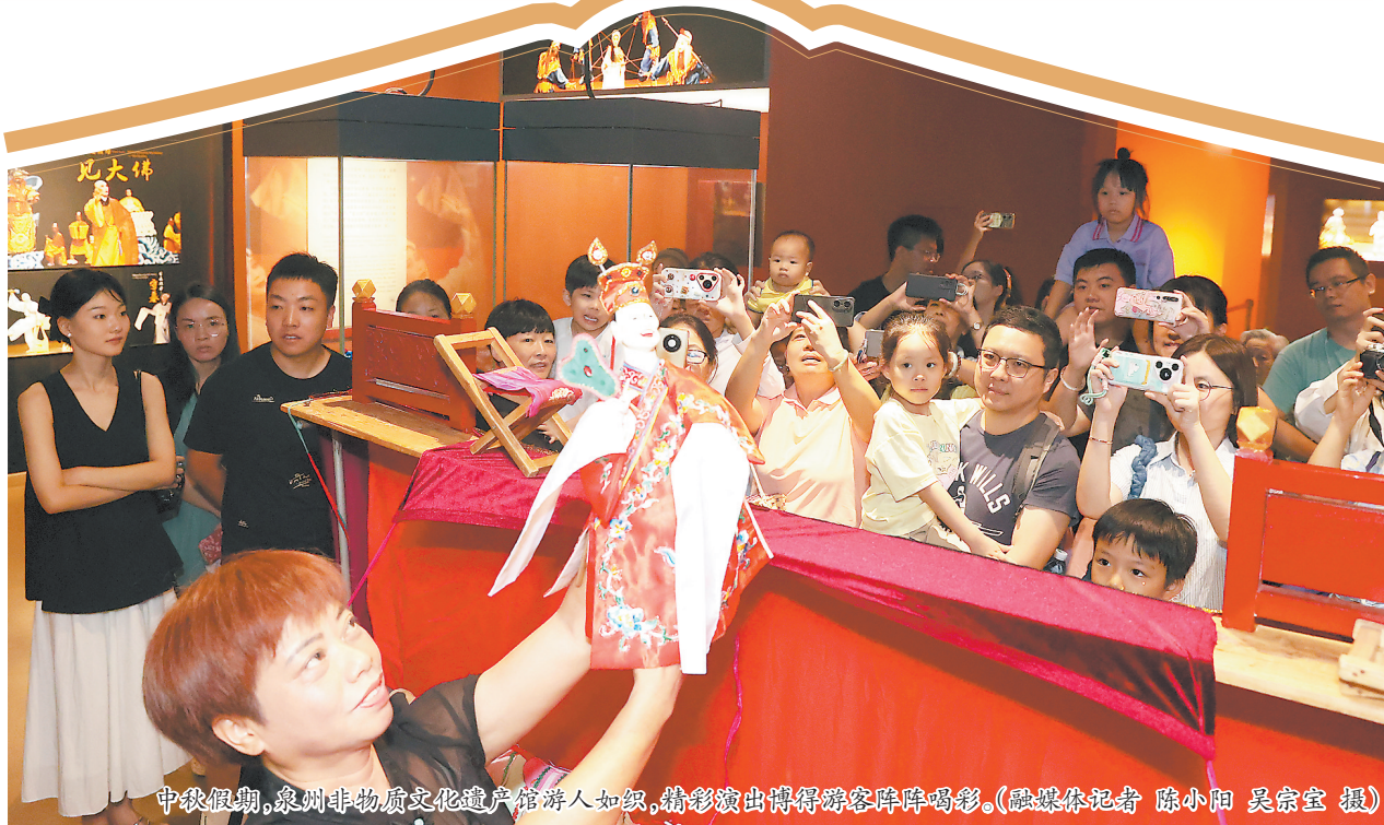
中秋假期，泉州非物质文化遗产馆游人如织，精彩演出博得游客阵阵喝彩。

在泉州非物质文化遗产馆，一场我们的节日·中秋——泉州收糕人制作体验活动吸引了40多人参与，大人陪着小孩共同制作、其乐融融。一双巧手、五彩面团，搓、捏、团、挑、揉、压、按、擦、拔……一套动作过后，幻化出栩栩如生的“嫦娥”等收糕人形象。为宣传普及非遗知识，泉州非物质文化遗产馆在中秋假期每天开放9个非遗项目全体验、展演，游客可以和非遗传承人现场互动交流。非遗工坊内还有掌中木偶戏、南音、高甲戏等展演。