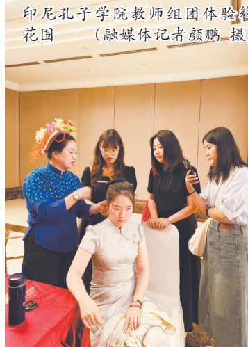
印尼孔子学院教师组团体验簪花围

“世界闽南文化节是一个致力于推广和传播闽南文化、促进国际文化交流与合作的国际性平台。通过举办各种文化活动为参与者提供了一个深入了解和体验闽南文化的机会。”主办方相关负责人说，簪花围的国际体验，更将这一文化符号推向了世界，让更多海外华侨华人和国际友人了解并爱上泉州的传统文化。