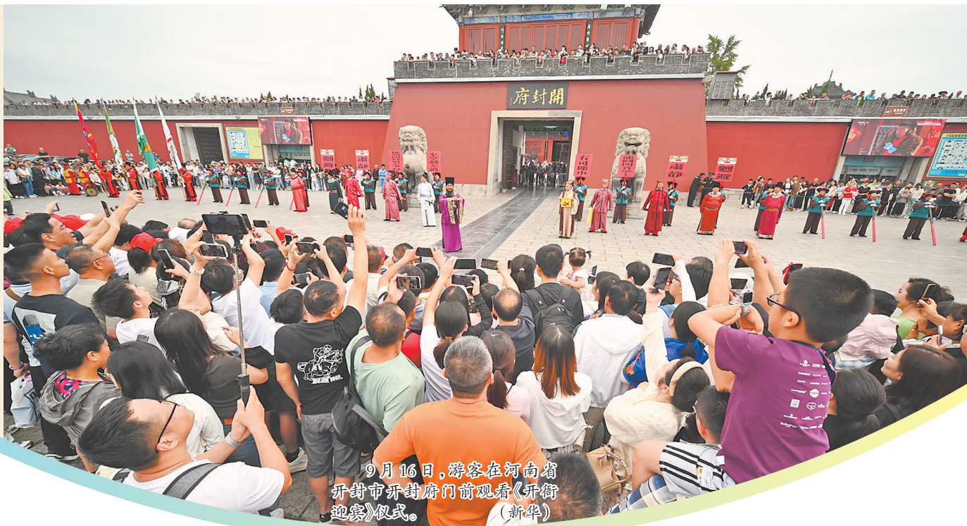
9月16日,游客在河南省开封市新街府门前观看《开街迎亲》仪式。

丹桂飘香,明月皎皎,又是一年中秋节。车站机场熙熙攘攘,热门景点人头攒动,影院剧场座无虚席……今年中秋假期,国内1.07亿人次出游、出游总花费510.47亿元,“人潮”带动“人气”,汇成一幅流动中国的优美画卷,折射中国经济稳中有进的发展态势。 □新华