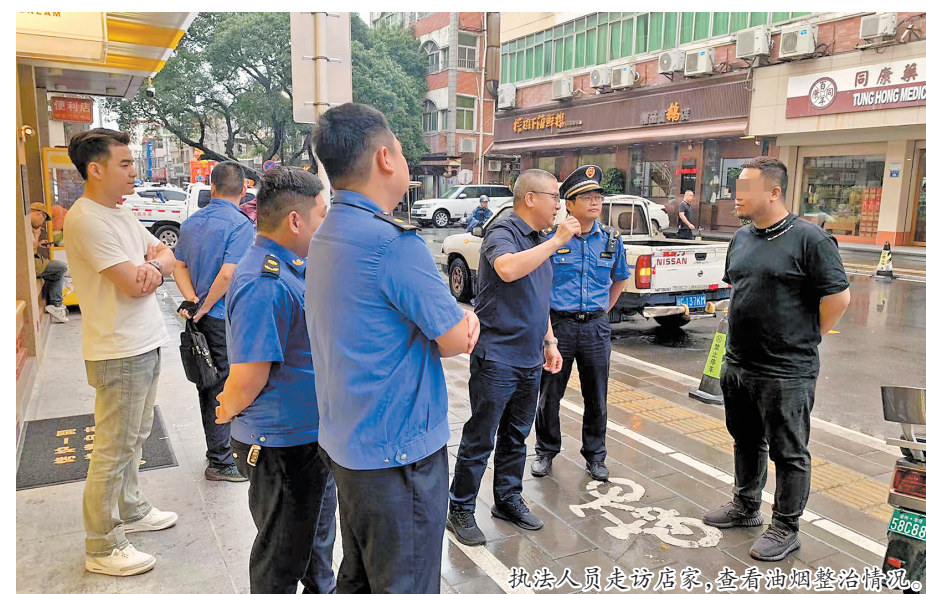
执法人员走访店家,查看油烟整治情况。

餐饮油烟“点题整治”工作开展以来,丰泽区城管局积极践行“721”工作法,坚持采用7分服务、2分管理、1分执法开展餐饮油烟污染防治工作,以群众的切身利益作为工作的出发点和落脚点,积极回应群众合理诉求,整治餐饮“油烟味”,解决百姓“烦心事”。