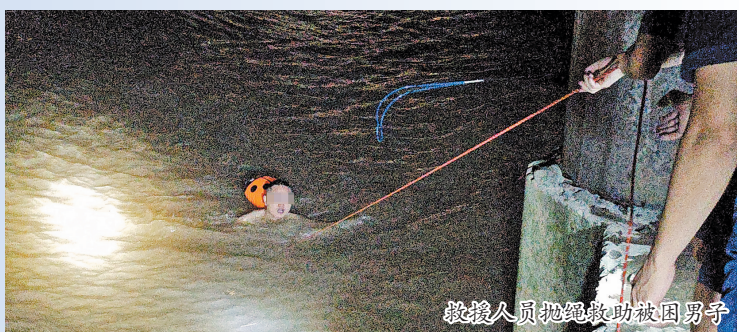
救援人员抛绳救助被困男子