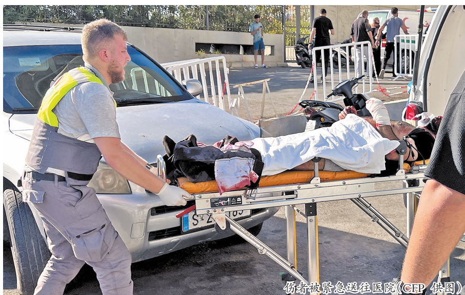
伤者被紧急送往医院。