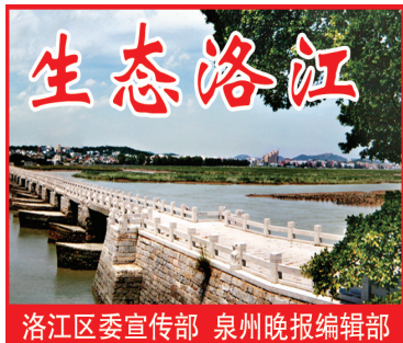
洛江区委宣传部 泉州晚报编辑部

联动组围绕资金申请、分配、拨付、管理、使用5个重要环节,对照图标串标、补贴冒领、资金滞留等8种情形,深挖细查涉农项目资金领域群众身边不正之风和腐败问题,通过“一日一汇报”“一周一清单”等形式,加强与省委巡视组的联动会商、把脉问诊,推动被巡视巡察单位落实工作、优化措施、完善制度,确保强农惠农政策在洛江落地生根。(陈含朴)