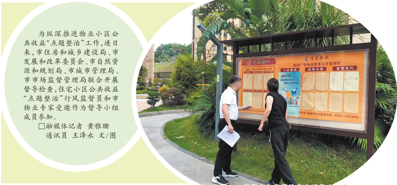
督导组现场检查小区物业服务公示栏

为纵深推进物业小区公共收益“点题整治”工作,连日来,市住房和城乡建设局、市发展和改革委员会、市自然资源和规划局、市城市管理局、市市场监督管理局联合开展督导检查,住宅小区公共收益“点题整治”行风监督员和市物业专家受邀作为督导小组成员参加。