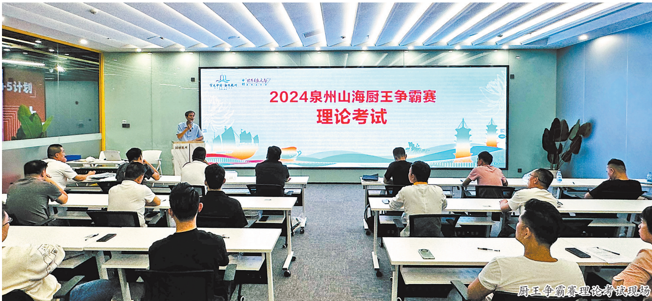
厨王争霸赛理论考试现场

现场,各参赛选手全神贯注,认真完成理论考试试题,展现出扎实的操作技能理论功底。此次理论考试的成功举办,不仅为今日现场技能实操总决赛的开展