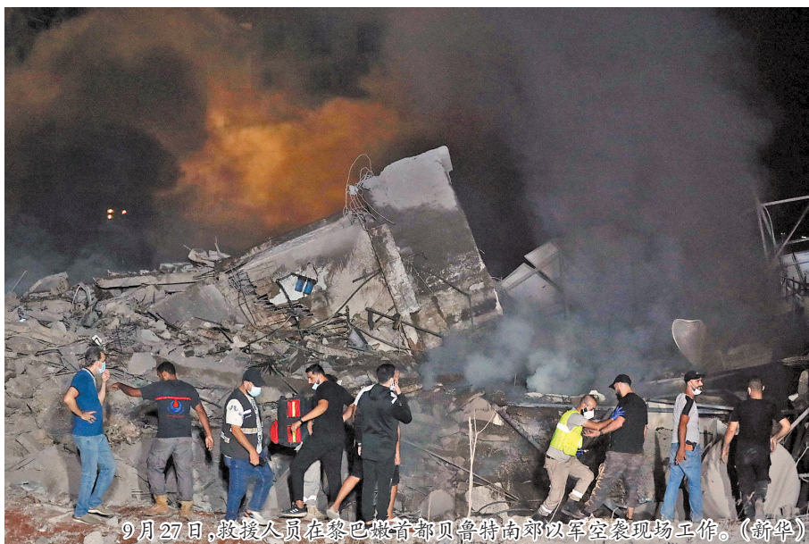
9月27日,救援人员在黎巴嫩首都贝鲁特南部以军空袭现场工作。

当地时间28日,以色列国防军发布最新声明称,黎巴嫩真主党领导人纳斯鲁拉在以军的空袭中身亡。声明称,以色列空军战机27日对位于黎巴嫩首都贝鲁特南部的真主党总部发起针对性打击,纳斯鲁拉、黎真主党武装南部战线指挥官阿里·卡斯基以及其他多名真主党武装指挥官在袭击中身亡。以军情报显示,空袭时黎真主党高层正在位于贝鲁特南部的一处住宅楼地下。据透露,伊朗方面已加强安全措施,最高领袖哈梅内伊已被转移到安全地点。 □中新 央视 晚宗