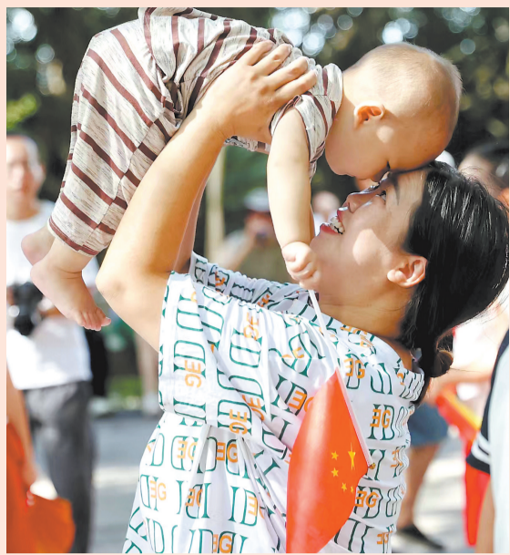
同喜同乐 在清源山老君岩广场,女子举起手握国旗的孩子,她的笑容充满了喜悦与自豪。