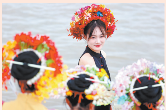
回眸一笑 丰泽区蟬埔社区的小码头簪花摇曳,从各地慕名而来的人在镜头前尽情展示自己最美的簪花围造型。