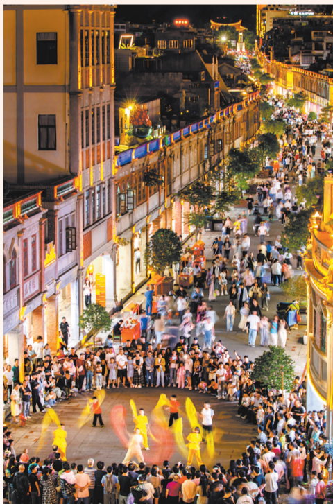
闪聚活力 在泉州古城中山路,快闪活动正在上演,欢呼声起,热闹非凡。