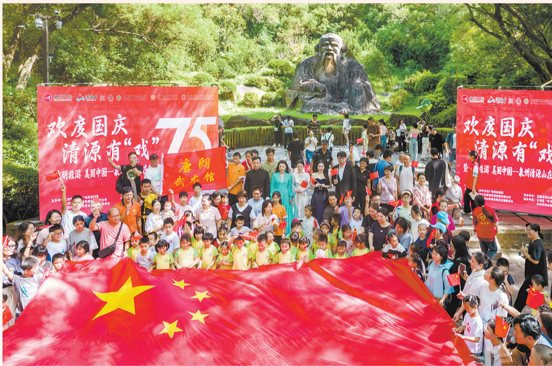
清源“红”了 在清源山老君岩广场,市民游客为新中国75周年华诞送上祝福。