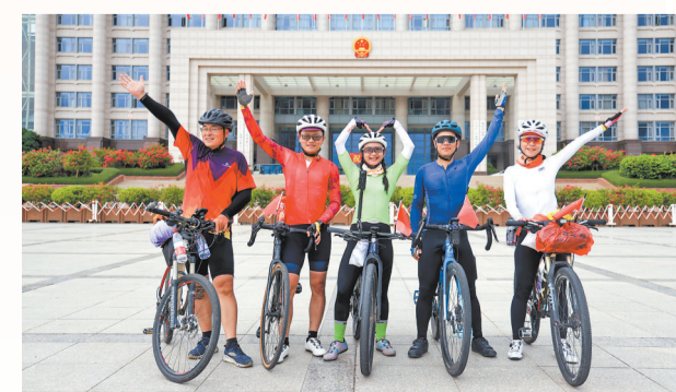
欢乐骑行 来自龙岩的骑行者到泉州时合影留念,他们用这种酷炫、独特的方式欢度国庆佳节。