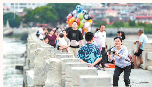
打卡“第一桥” 市民游客打卡素有“海内第一桥”之称的洛阳桥,共同感受世遗之美,记录下这美好的时刻。