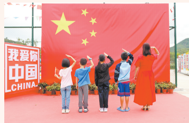
与国旗同框 在洛江区罗溪镇后溪村,巨幅国旗吸引了众多市民游客驻足仰望,合影留念。