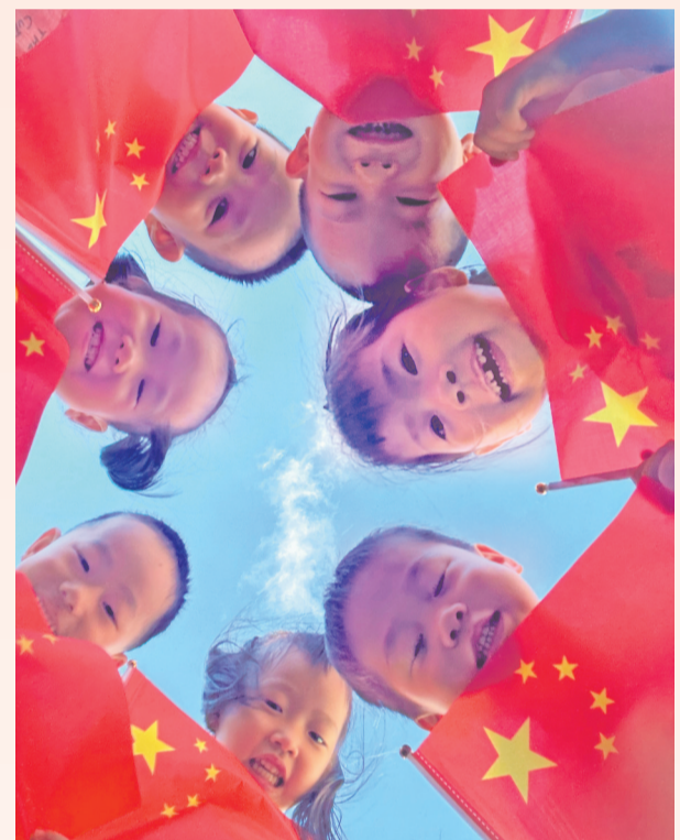
童心献礼 德化县阳光幼儿园的小朋友手捧国旗,表达对祖国母亲的热爱与祝福。