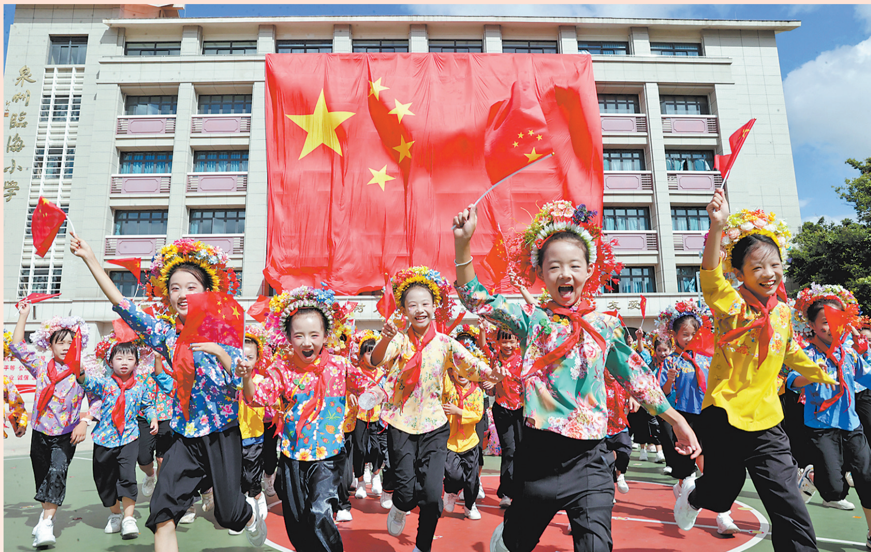
喜迎国庆 位于丰泽区东海街道蟬埔社区的临海小学开展“簪花红 爱国心 千人同庆颂华章”活动,孩子们头戴簪花与国旗合影,喜迎国庆节的到来。