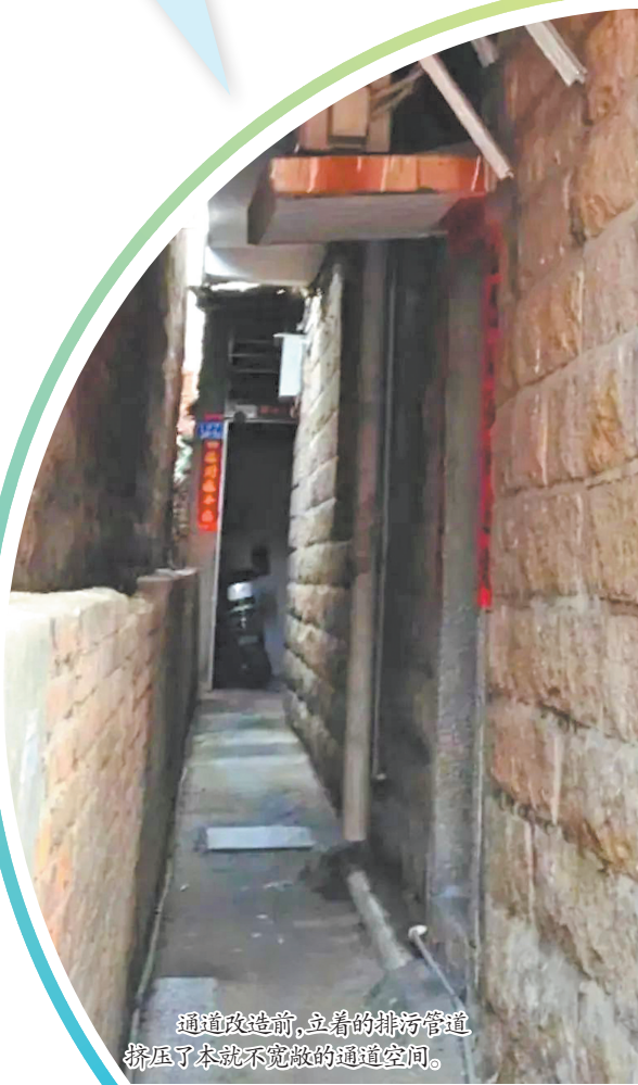
通道改造前,立着的排污管道挤压了本就不宽敞的通道空间。