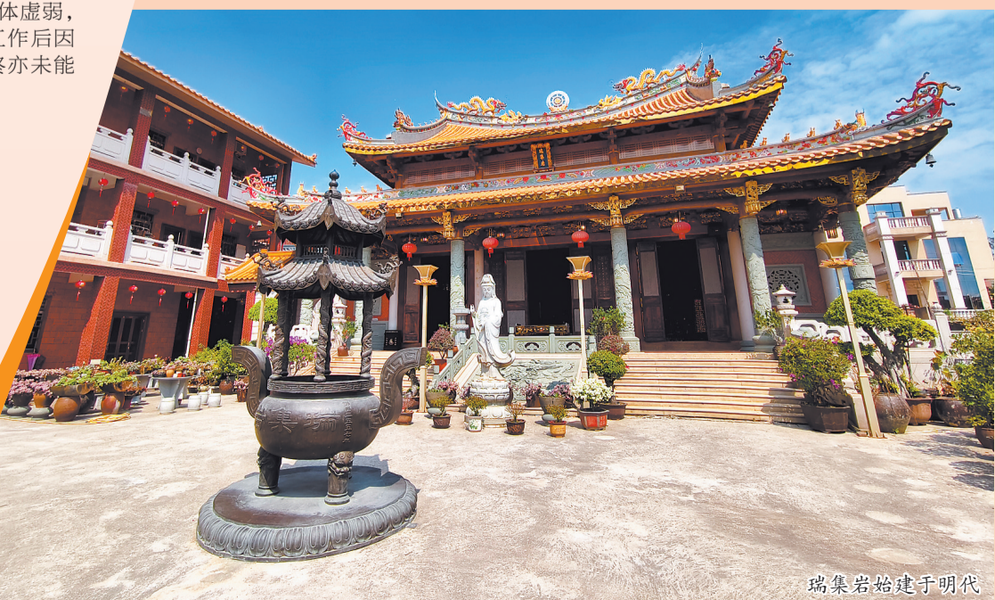
瑞集岩始建于明代

竟清凉”……大师留下的每幅书法,迄今被惠人视为“文化珍宝”。特别值得一提的是,弘一大师书赠惠安医师杜安人藏头联:“安宁万邦,正需良药;人一相,乃谓大慈。”同时,弘一大师还将旧藏贵重西药十四种交付杜医师,嘱其普施贫民。杜氏极为感动,把弘一大师的墨宝作为立身处世的座右铭,同时倾其余生义诊济困。弘一大师正是以至善至清的品行影响着世人,也让更多的善良在世間生长繁衍。