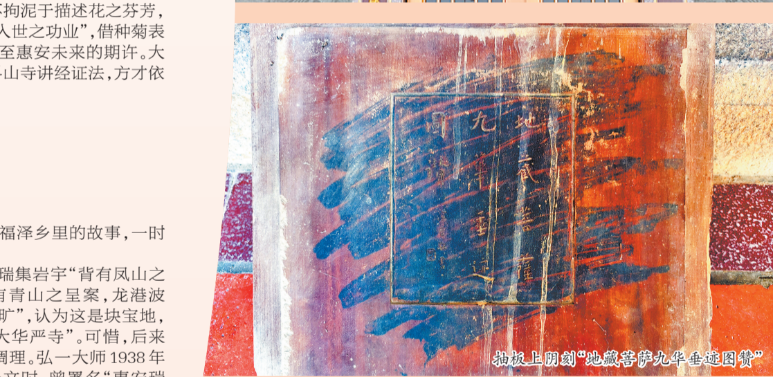
抽板上阴刻“地藏菩萨九华垂迹图赞”