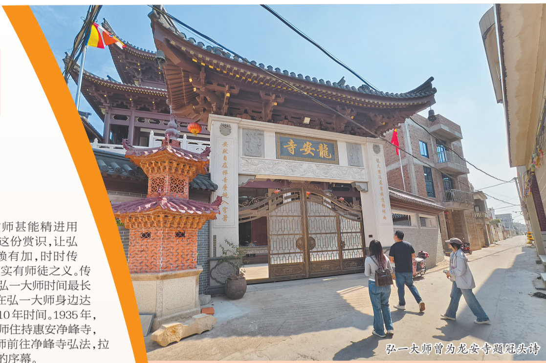
弘一大师曾为龙安寺题冠头诗