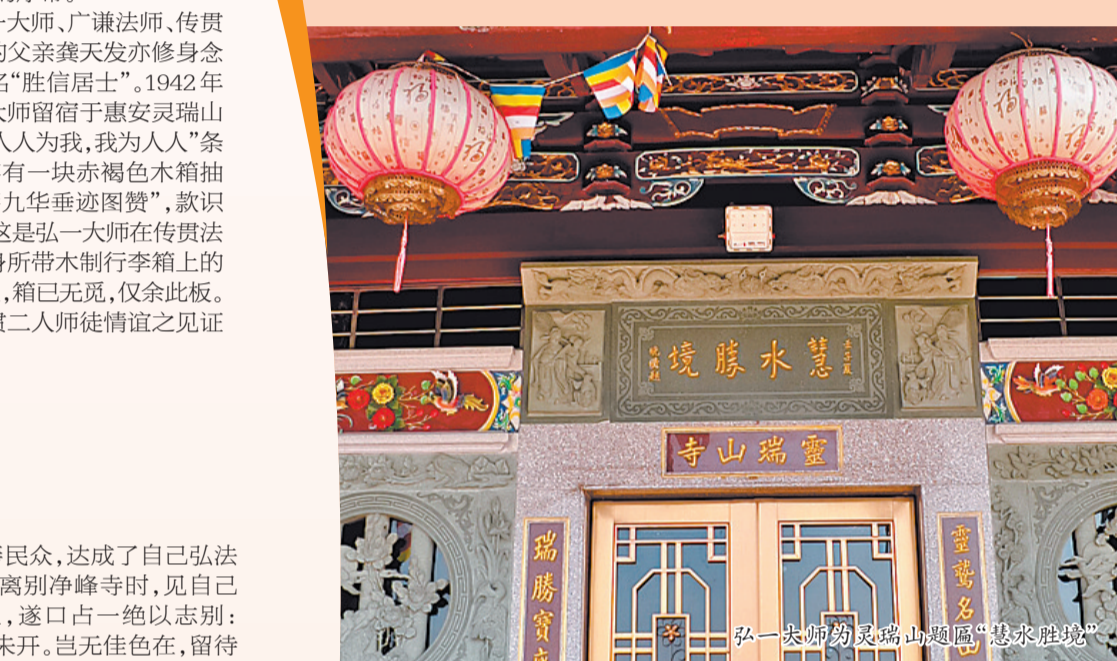
弘一大师为灵瑞山题匾“慧水胜境”