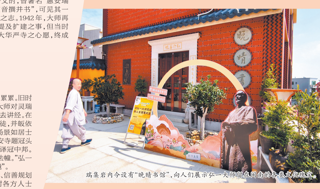
瑞集岩内今设有“晚晴书馆”,向人们展示弘一大师留在闽南的各类文化瑰宝。

1942年,弘一大师与僧侣、信善规划在灵瑞山兴建大药师寺。当时各方人士均表示支持。可惜后来大师身体虚弱,移锡泉州温陵养老院。建寺工作后因多种因素停滞。此项善愿最终亦未能实现。