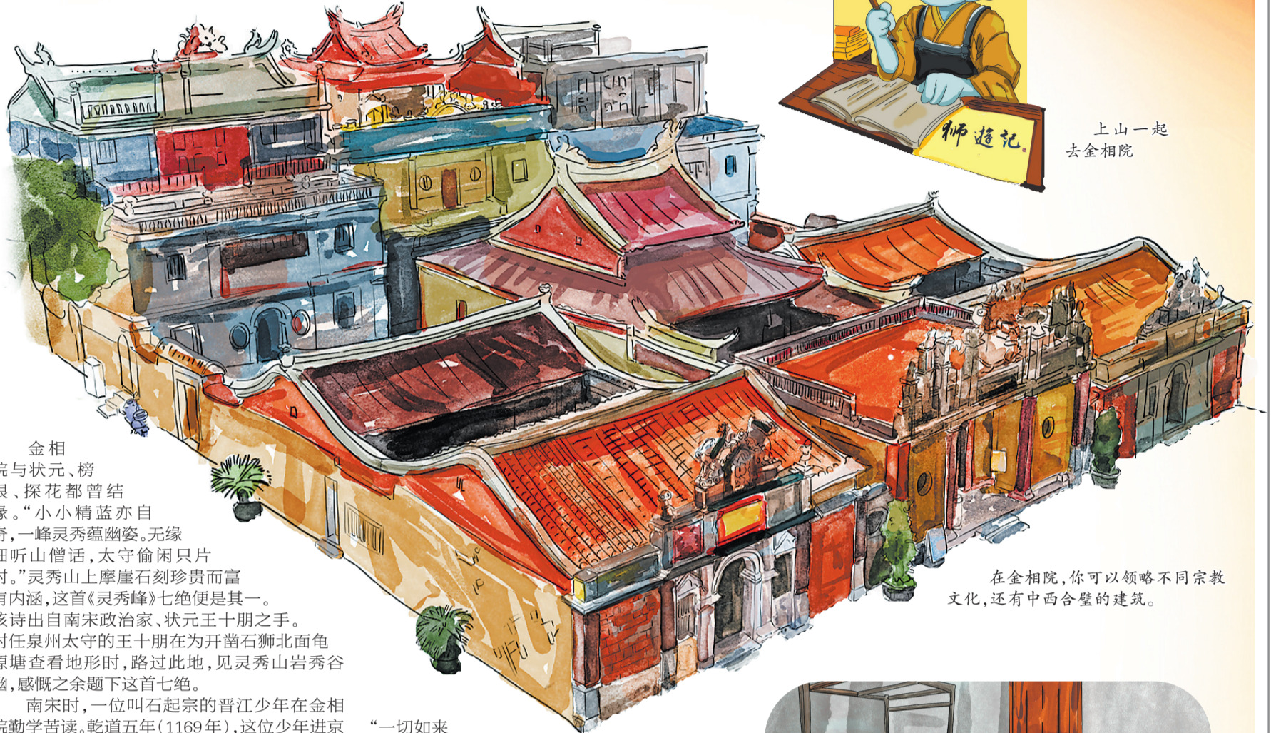
上山一起 去金相院