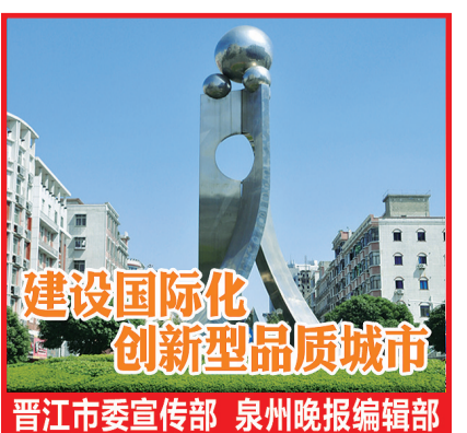
建设国际化 创新型品质城市

据悉，陈埭市场监督管理所开展“质量月”系列活动，旨在推动企业质量管理发展，加强重点产品质量保障，为陈埭镇经济高质量发展和保护消费者权益做出积极贡献。