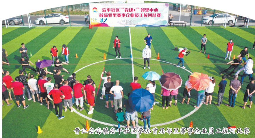
晋江安海镇安平社区举办首届邻里赛企业员工拔河比赛

晋江灵源街道大山后社区四周均与经济开发五里园区接壤，是个典型的园中村。为推进大山后社区和五里园区融合发展，灵源街道党工委和经济开发区委组织部聚焦服务园区产业升级，建立跨区议事协商机制，动员园区企业捐资400万元投入大山后社区乡村振兴攻坚行动项目建设中，为社区发展建设注入“源头活水”，引导社区盘活闲置廉租房、居民出租