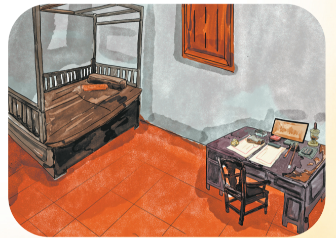
弘一法师曾在此翰墨传薪