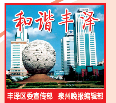
和谐丰泽 丰泽区委宣传部 泉州晚报编辑部

日前,丰泽区华大街道新铺社区开展“赋能年轻一代 共筑韧性未来”义诊宣传活动,提高社区居民健康意识,普及医疗保健知识。来自社区卫生服务中心的医护志愿者为现场居民逐一量血压、测血糖、辨体质,耐心解答各类问题,帮助了解自身健康状况,提供医疗服务和健康指导;社区志愿者则向过往群众发放科普传单,宣传疾病预防、均衡饮食、合理运动等养生知识,助力践行全民健康生活方式。