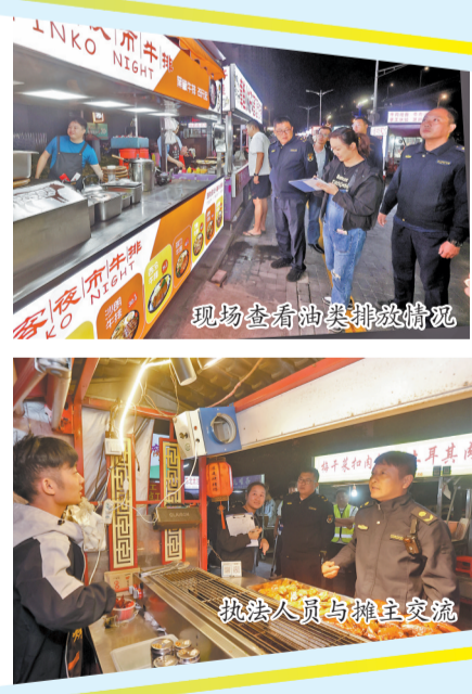
执法人员与摊主交流