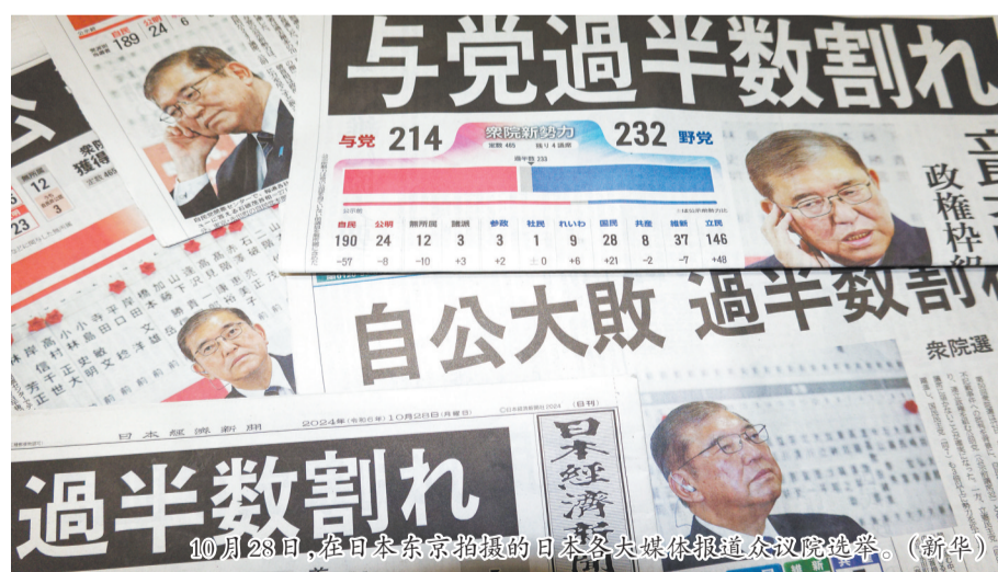
10月28日,在日本东京拍摄的日本各大媒体报道众议院选举。

而在野势力由选前的186席一跃增至250席。其中,最大在野党立宪民主党议席由原先98席增至148席;国民民主党席位达到28席,是选前议席的4倍;只有维新会议席降至38席。