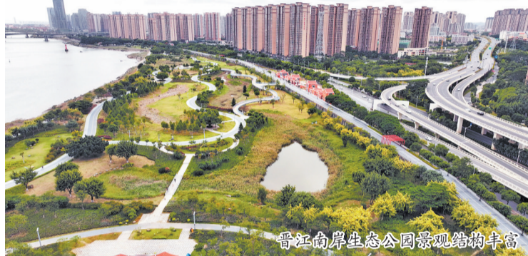
晋江南岸生态公园景观结构丰富