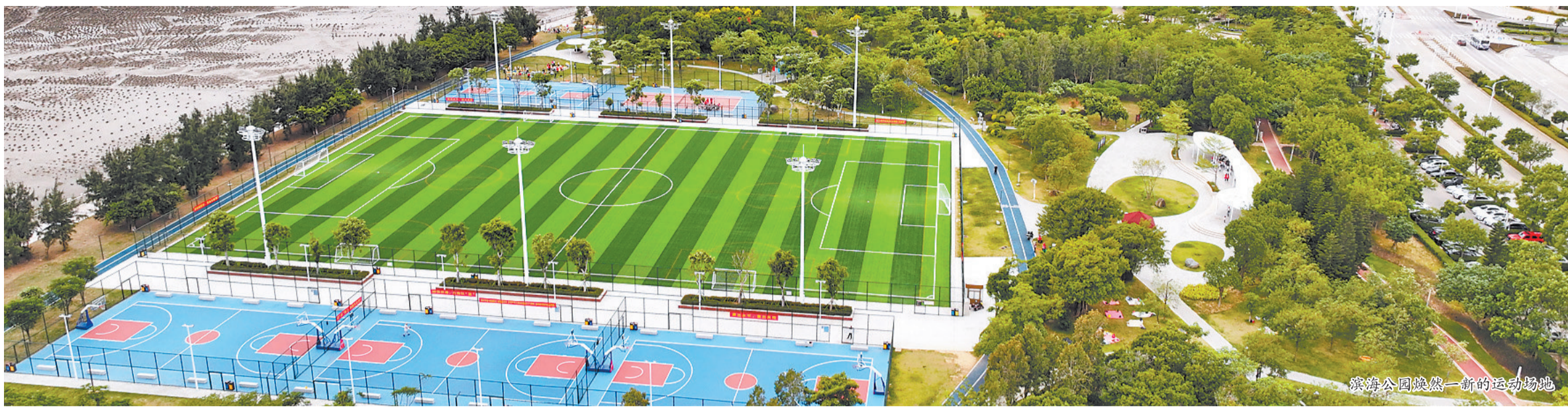
滨海公园焕然一新的运动场地