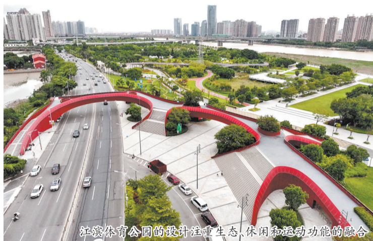
江滨体育公园的设计注重生态、休闲和运动功能的融合