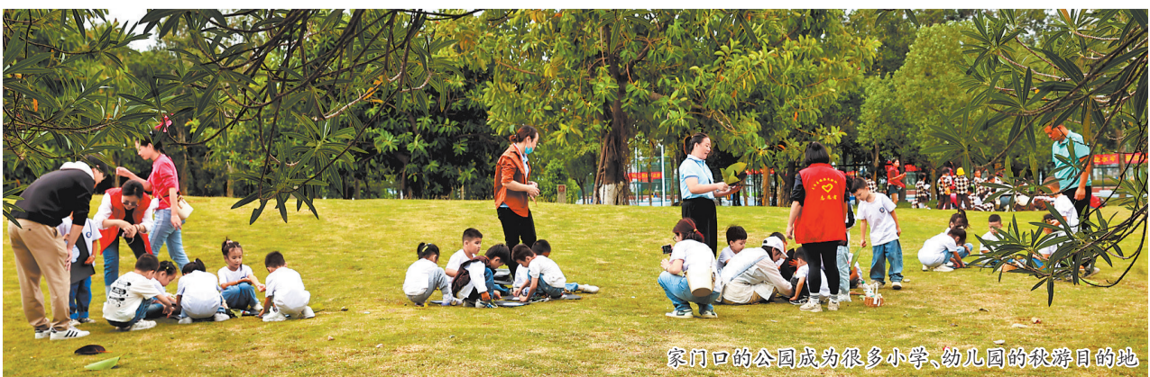
家门口的公园成为很多小学、幼儿园的秋游目的地