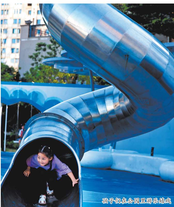
孩子们在公园里游乐嬉戏