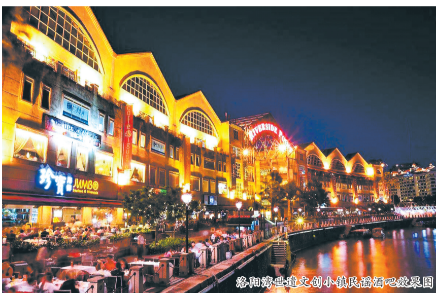
洛阳湾世遗文创小镇民福酒吧效果图

项目策划以千年洛阳桥为文化核心,以滨海商港文化为主题,通过古桥、古镇、老街的修缮和文化演绎,再现千年海丝商港的繁华盛景,通过引入沉浸式实景演艺、艺文首店、海街酒吧、度假院落等业态,打造集城市休闲、文旅游于一体的复合型旅游目的地。项目还将以“电商一站式赋能平台”结合泉州国潮国货的制造业优势,引入“红人电商产业链”,提供电商直播代运营相关