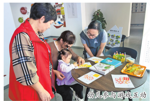
幼儿参与游戏互动

下一步,东园镇小区联合党委将继续发挥多方资源优势,深化小区、家庭、幼儿园“三位一体”早教共建活动,让居民切实感受家门口的“幸福味道”。