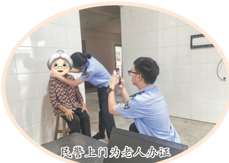
民警上门为老人办证

本报讯(融媒体记者张晓玲 通讯员张文荣 文/图)秋意浓浓,天气渐冷。在茶乡的大街小巷里,安溪公安是不期而遇的一抹温暖“警”色,他们用一件件为民服务的平凡警事让守护更有温度。