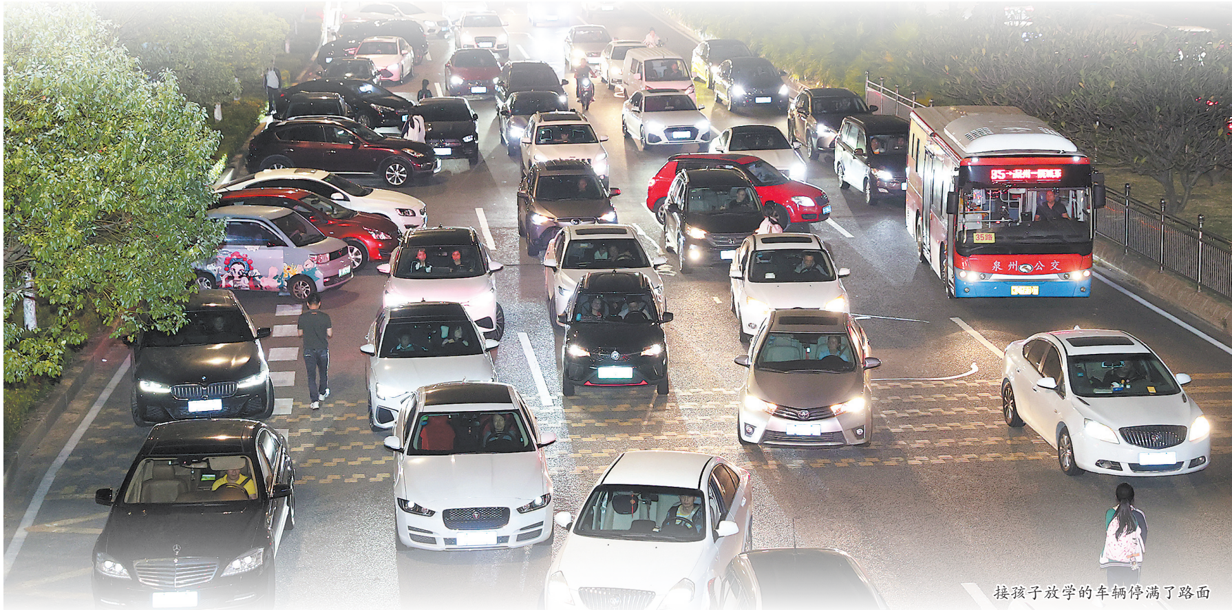
接孩子放学的车辆停满了路面