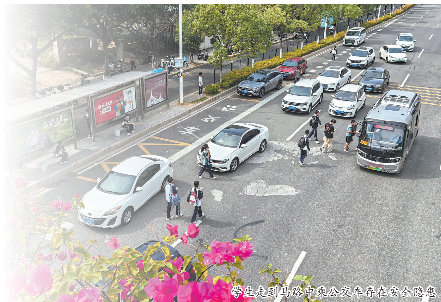
学生走到马路中乘公交车存在安全隐患

车道。12时20分左右,校门口车道恢复正常。从记者以往走访情况看,晚上放学时段是真正的车流高峰期。4日18时,大量学生从学校出来,前来接学生的