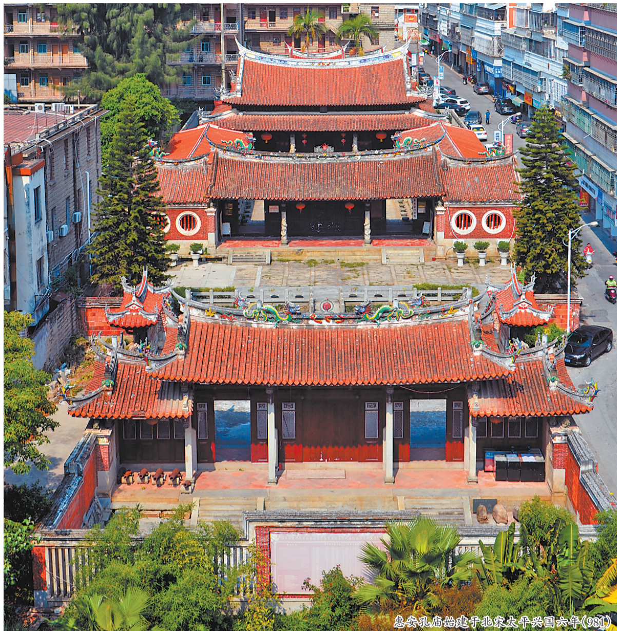
惠安孔庙始建于北宋太平兴国六年(981)