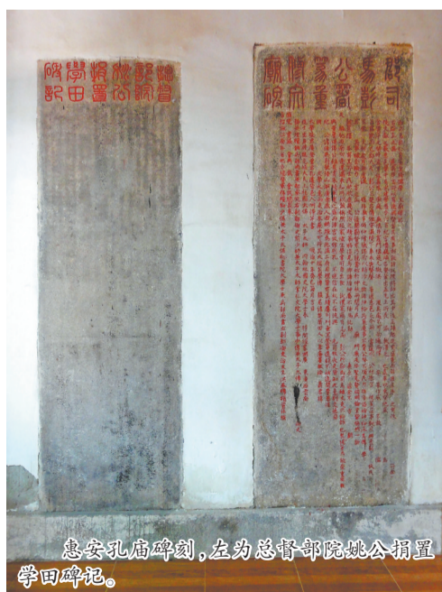
惠安孔庙碑刻,左为总督部院姚公捐置学田碑记。