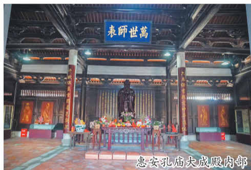
惠安孔庙大成殿内部