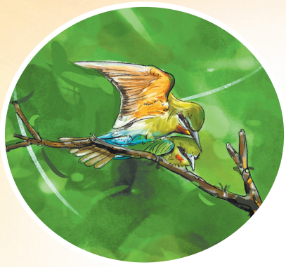
“中国最美小鸟”上演狮城热恋

初冬季节，滨海城市石狮却依旧有着如画的美景。上期我们一起去了哨所公园，这次“狮千岁”我活力满满，想带上各位亲爱的“北方大冻梨”“南方小土豆”，一起去峡谷旅游路赏景兜风，感受一下那里的“美景大餐”。