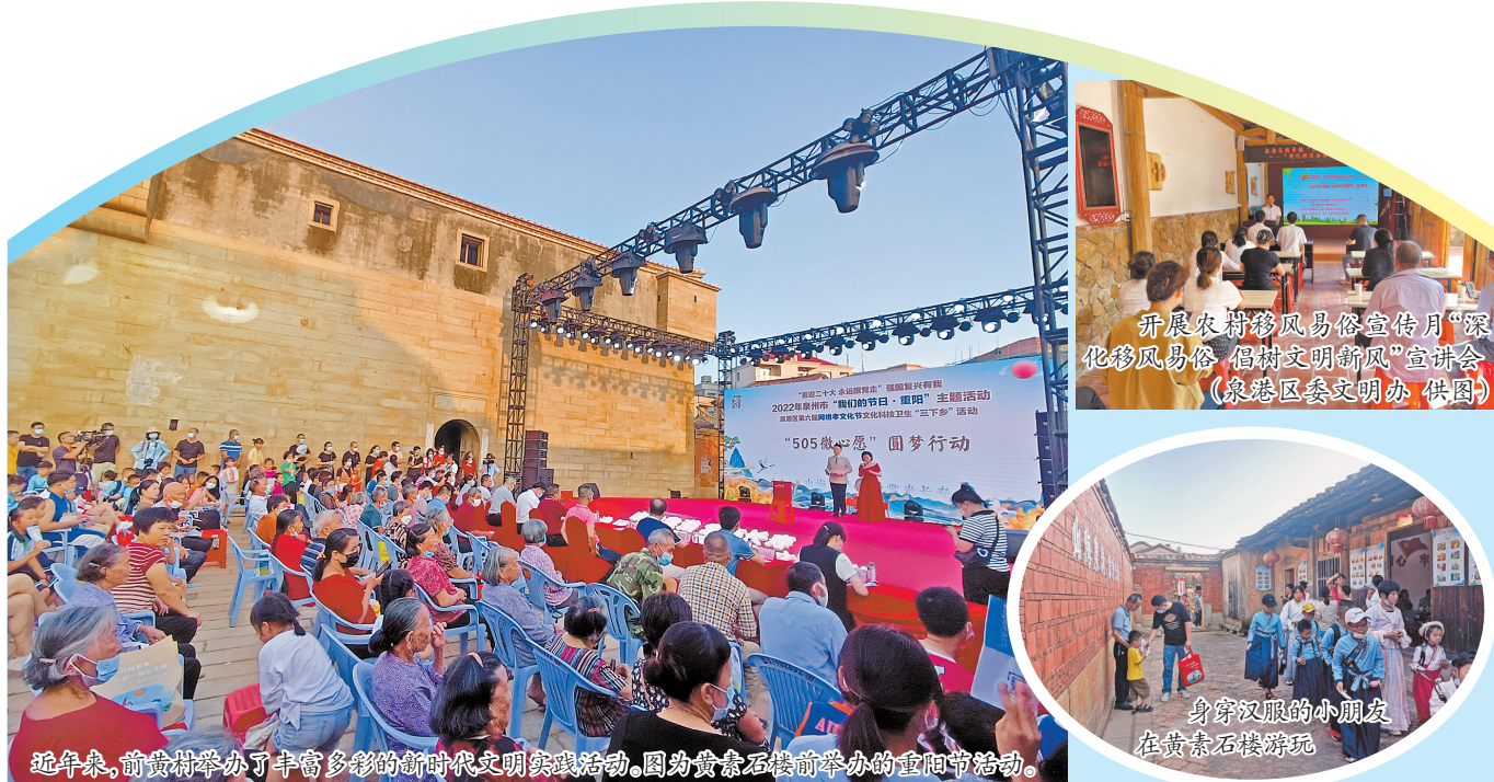
近年来,前黄村举办了丰富多彩的新时代文明实践活动。图为黄寨石楼前举办的重阳节活动。

激活古建筑新活力,更是激发群众主动参与文明实践的新路径,通过多种形式的共建共享,前黄村正在探索一种新的形