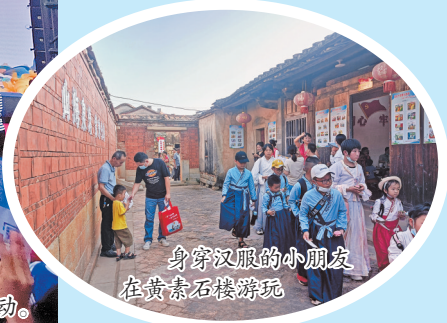
身穿汉服的小朋友在黄寨石楼游玩

式。在文明实践的引领下,群众参与进来,让文明实践活动在微场景中实现,在微小切口入深,润物细无声地讲好前黄故事。