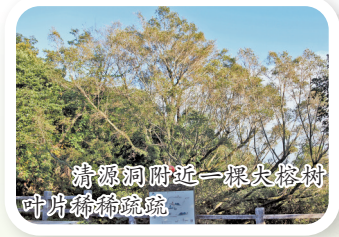
清源山附近一棵大榕树叶片稀疏