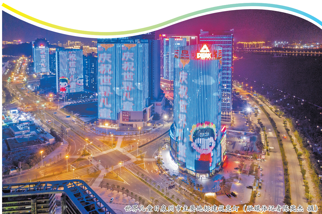
世界儿童日泉州市主要地标建筑亮灯

永春专场活动地点则设在永春县残联福乐家园,邀请爱心儿童和孤独症儿童开展互动游戏,提供孤独症家长喘息服务,倾听每个心声,关注特殊群体,践行儿童友好理念。