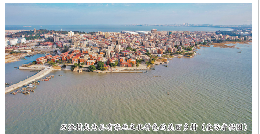
石渔村成为具有海丝文化特色的美丽乡村