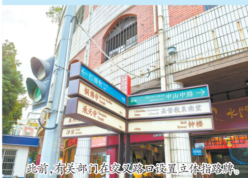
此前,有关部门在交叉路口设置立体指路牌。