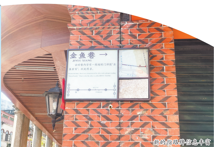
新的指路牌信息丰富