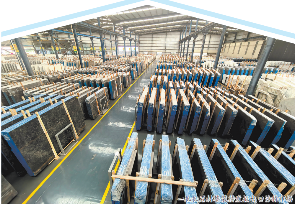
福建首家 AEO 认证石材企业出口石材

据泉州海关统计,今年1—10月,泉州市石材出口62.2亿元,列全国地级市第一位。其中,出口 AEO 互认国家(地区)46.3亿元,占泉州市石材出口总值的74.4%。从出口 AEO 互认国家(地区)看,出口欧盟、泰国、阿联酋分别增长3.9%、27.4%、54.6%。