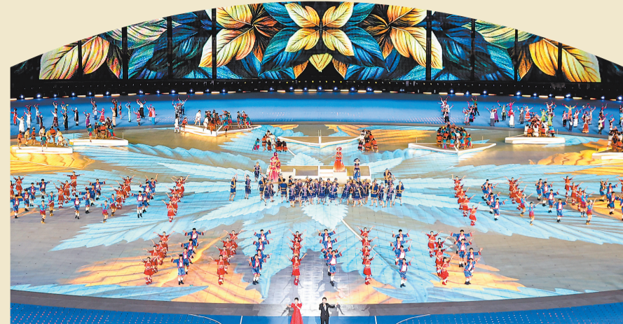
11月30日,第十二届全国少数民族传统体育运动会闭幕式在海南省三亚市举行。图为演员在闭幕式上表演。