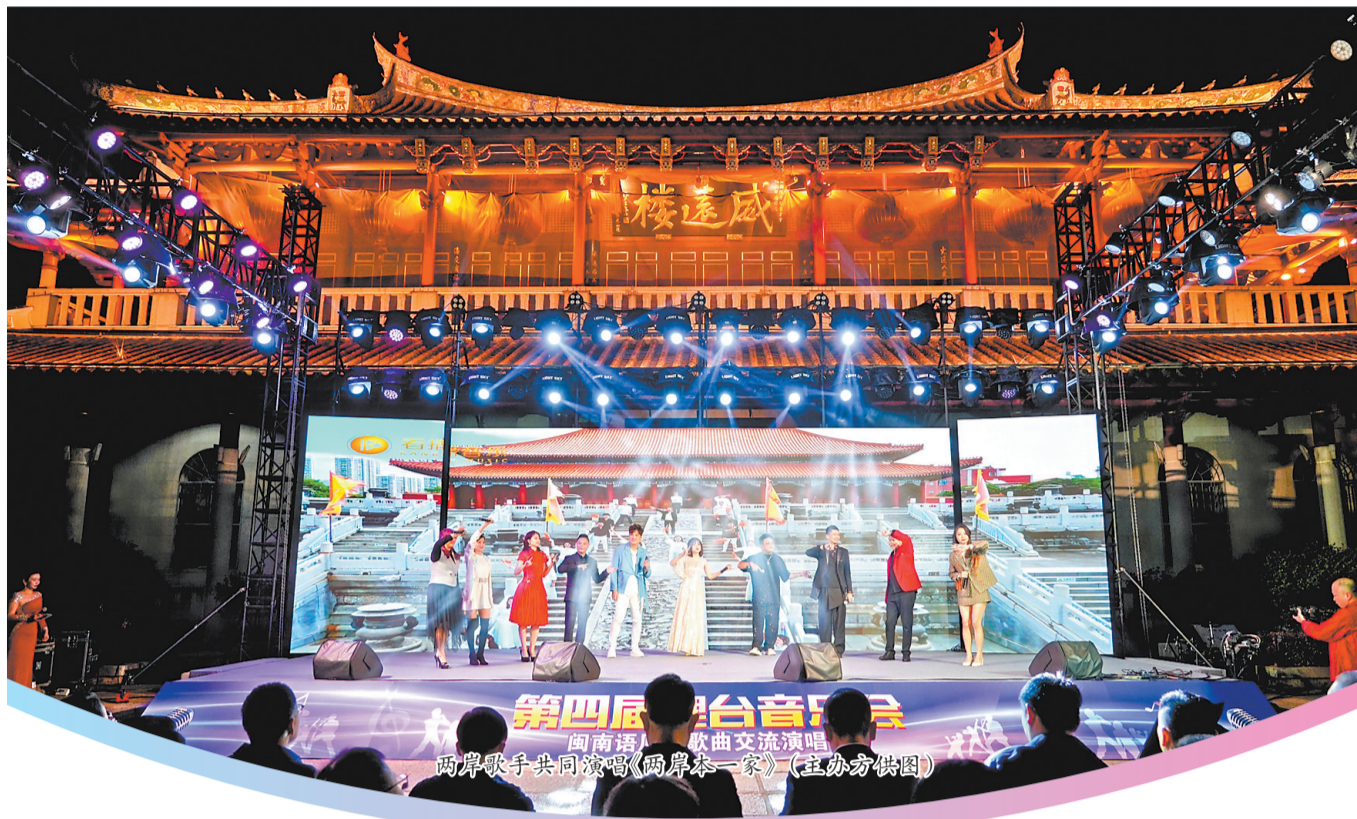
此次交流演唱会在泉举行,激发两岸音乐人的创作热情,创作出更多动听的闽南语歌曲。

“两岸一家亲,闽南语是我们共同的语言,这场演唱会让海峡两岸的音乐人相聚在美丽的世遗泉州,共同唱响各自闽南语原创歌曲代表作品,用他们的歌声讲述关于家、关于爱、关于梦想的故事,用音乐搭建起一座沟通的桥梁。通过动人的旋律,让现场观众充分感受到跨越海峡的深情厚谊和流淌在旋律中的爱与温暖。”主办方相关负责人表示,希望