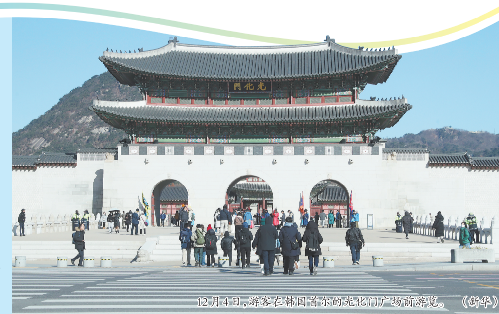
12月4日,游客在韩国首尔的光化门广场前游览。

4日凌晨,韩国解除总统尹锡悦于前夜发布的紧急戒严令。持续数小时的戒严令已解除,但韩国政坛所面临的危机短时间内仍难以解除。紧急戒严风波震惊韩国朝野乃至国际社会,凸显韩国政治对立严重。