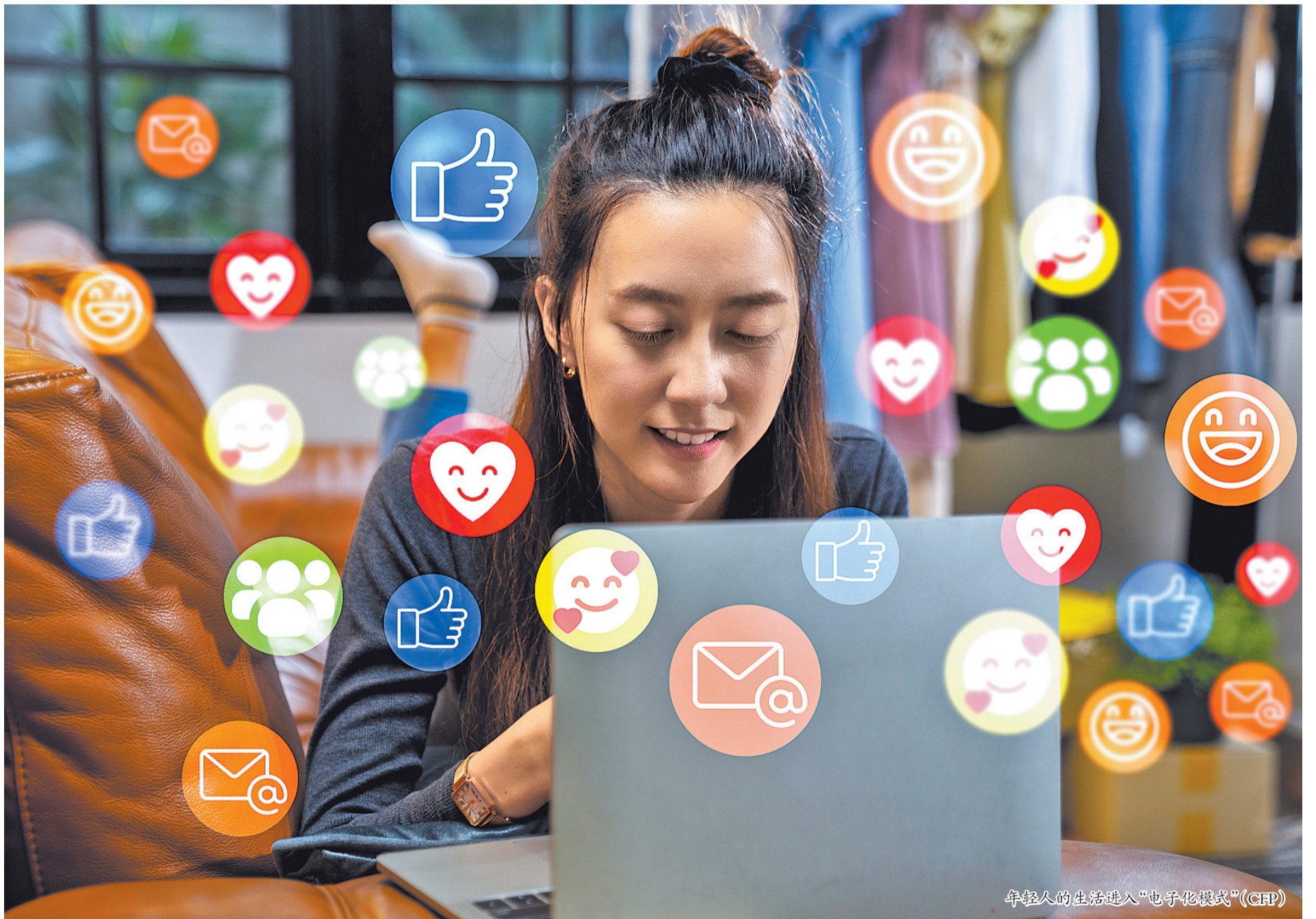
年轻人的生活进入“电子化模式”(CFP)