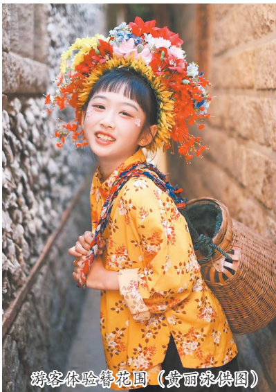
游客体验簪花围