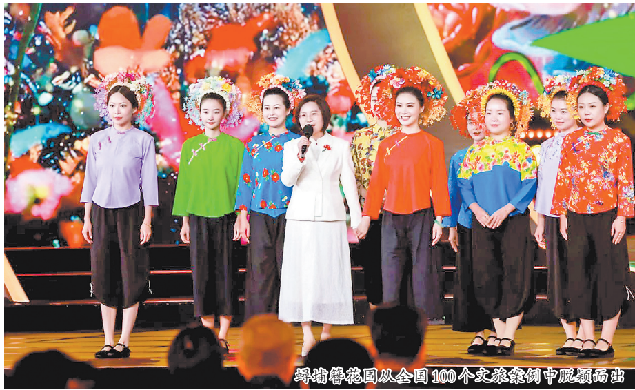
蟳埔簪花围从全国100个文旅案例中脱颖而出

记者从市文旅局获悉,11月30日晚,“文旅经济盛典”在央视财经频道播出。盛典现场,备受瞩目的“2024十大文旅经济创新案例”正式发布,福建泉州蟳埔·簪花围作为代表“创新文化+”的典型案例分析上榜,成为首个上台分享推介的创新案例。据介绍,福建在全国率先探索女性元素的营销方式,吸引了众多消费者关注和喜爱福建的国潮传统文化产品。