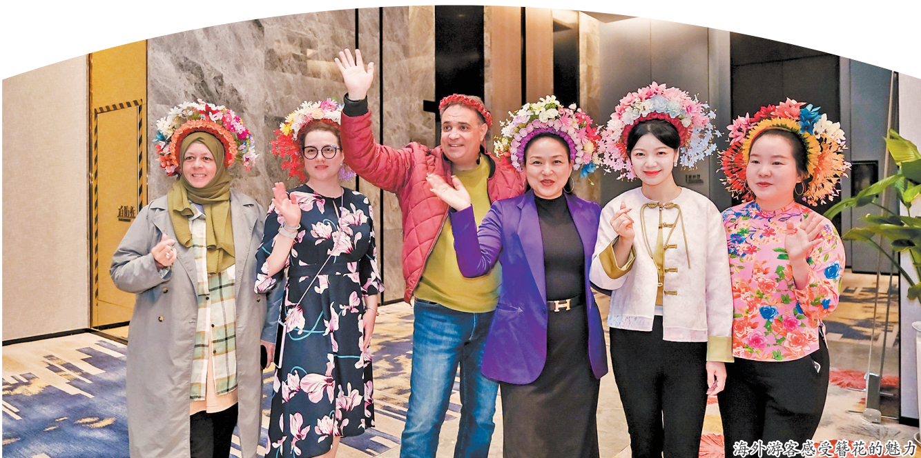
海外游客感受簪花的魅力