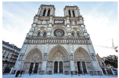
法国著名地标性建筑巴黎圣母院,在2019年大火中受损严重。经过五年的修复,它以全新的面貌重新矗立在塞纳河畔。当地时间12月7日,巴黎圣母院举行重新开放仪式,并将于12月8日正式对公众重新开放。(央视)

张弘认为,总的来说,拉夫罗夫的这次访谈在一定程度上明确了俄罗斯的立场,增强了俄罗斯与西方进行博弈的信心。他希望通过这种方式,影响到特朗普未来的乌克兰和平计划,为俄乌冲突的和平解决创造有利条件。