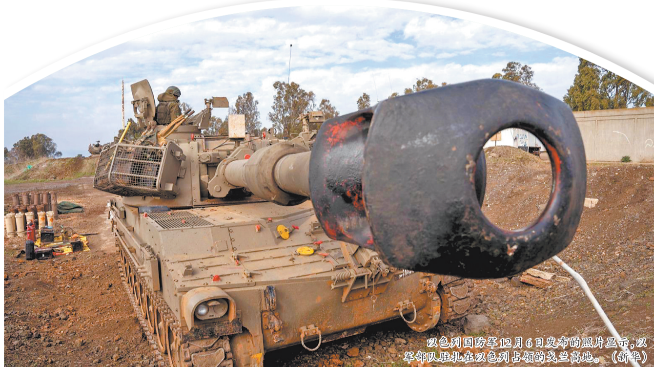
以色列国防军12月6日发布的照片显示,以军部队驻扎在以色列占领的戈兰高地。

本报讯 叙利亚军方7日发表声明说,叙政府军已在叙南部德拉省和苏韦达省进行了“重新部署”,已在这两个地区建立起防御工事和安全警戒线。以色列国防军6日发表声明说,鉴于当前叙利亚局势的发展,以方正加强其控制的戈兰高地地区的地面和空中兵力部署。