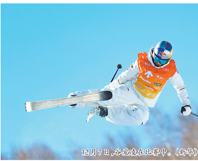
12月7日,谷爱凌在比赛中。

男子组决赛中,美国选手大卫·怀斯在第一轮中拿到89分,早早锁定了一枚奖牌。之后卫冕冠军、美国选手亚历克斯·费雷拉一套动作技惊四座,以92.25分排名第一。北京冬奥会自由式滑雪坡面障碍技巧亚军、美国选手尼古拉斯·戈珀在比赛就要尘埃落定之际展现出“大心脏”,第二轮最后一个出场的他最终获得95.00分,逆转摘金。